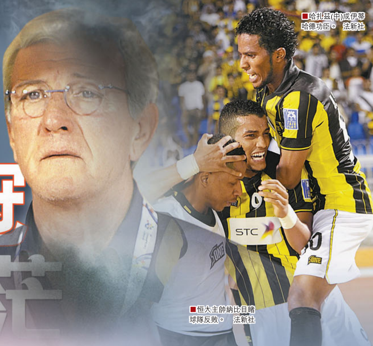
恒大主帥納比目睹球隊反敗。