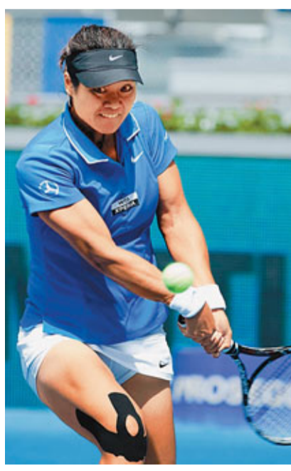
李娜力爭打年終賽。

香港文匯報訊(記者 梁啟剛) 中國網壇一姐李娜已經正式確認參加24至30日在日本東京舉行的泛太平洋公開賽，為年終總決賽的參賽資格放手一搏。由於世界前8名球手將可參加年終總決賽，李娜目前以4152分世界排名第8，斯托瑟暫時還是以3571分排名第9；雖然李娜目前領先斯托瑟近600分，但還是不保險；所以說，能否在東京和北京兩站比賽中取得好成績，對李娜來說至關重要。