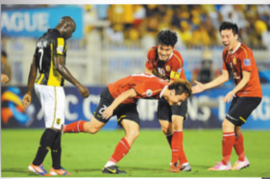
恒大次回合主場要爭取更多入球。