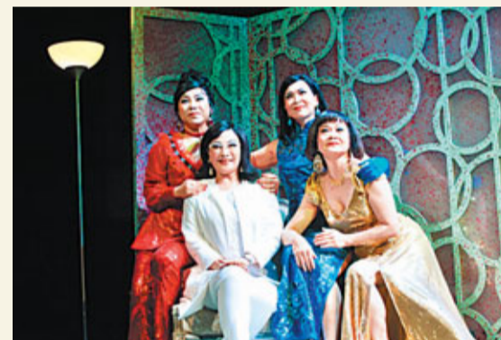
■《我和秋天有個約會》劇照