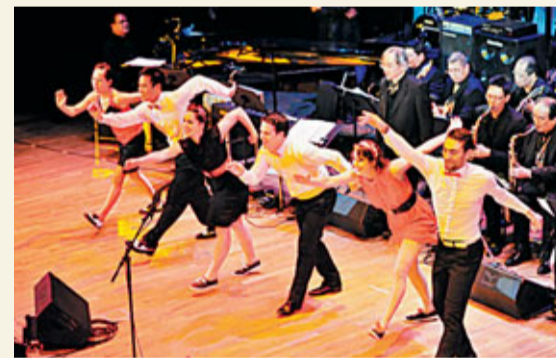
■Hong Kong Swings演出照