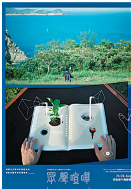
■《眾聲喧嘩》的海報已經有點實驗意味。

《眾聲喧嘩》由十五個劇場段落所組成，由極權社會老大哥的操控、叮嚀故事、羅密歐與茱麗葉的後現代版到世界末日的冷酷異境，語言風格各異，但其稠密度都異常飽滿，接近前進進戲劇工作坊這幾年大力推廣的「新文本」。可以這麼說，跟近年幾位實驗劇場年青創作人的作