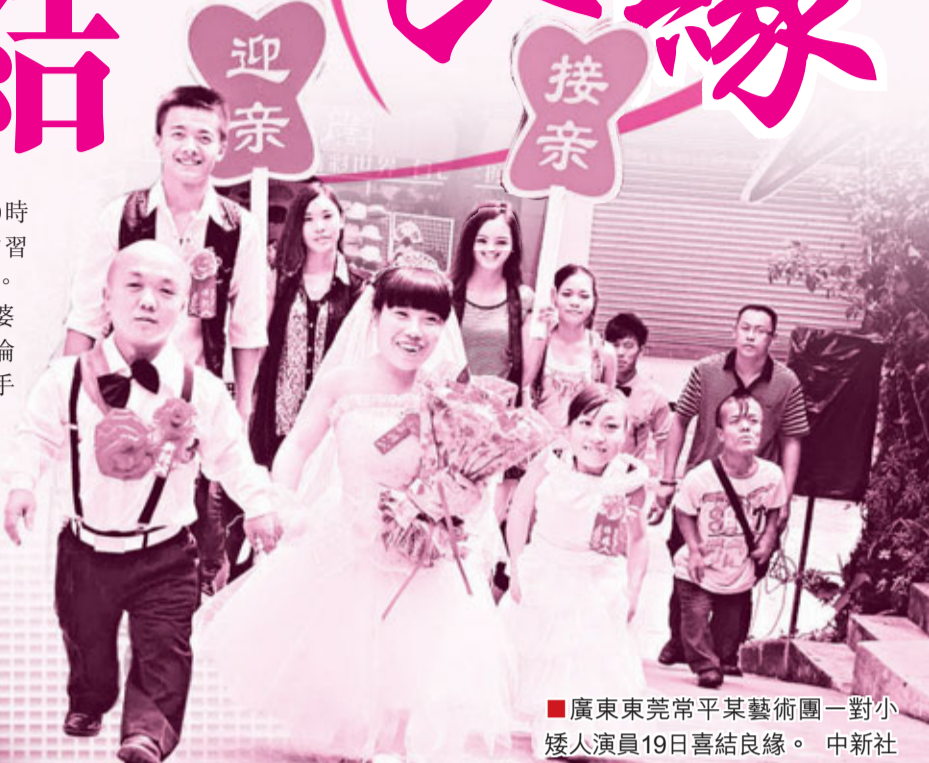
廣東東莞常平某藝術團一對小矮人演員19日喜結良緣。

在婚禮現場，新郎新娘深情地說：「雖然沒有雙方父母與親人的祝福，我們也不會感到孤單。」