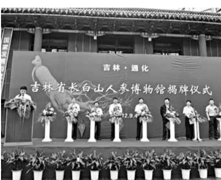
吉林省長白山人參博物館日前舉行開館揭牌儀式。

吉林省長白山人參博物館是由吉林老參堂投資5,000多萬元，歷時3年修建而成。博物館佔地面積2,500多平方米，集人參收藏、保護、展示、研究為一體，由人參史溯源、長白山人參文化、人參功效和珍寶館四個單元構成。長白山人參博物館的建成與使用，將以文字、圖片、實物等形式展示長白山人參神秘的過去，蓬勃發展的現在和前景廣闊的未來，對推動人參產業的健康發展將起到積極的作用。館內富