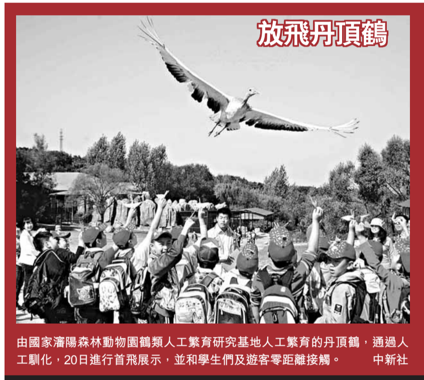
由國家瀋陽森林動物園鶴類人工繁育研究基地人工繁育的丹頂鶴，通過人工馴化，20日進行首飛展示，並和學生們及遊客零距離接觸。