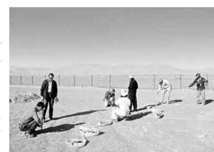
中國和日本科研人員聯合調查莫高窟水環境。圖為兩國科研人員進行高密度電法調查。

此次科研主要對莫高窟崖體水汽電阻率、植被分佈、戈壁砂礫中鹽分分佈、防護林帶電阻率及108窟西壁電阻率等內容展開調查。