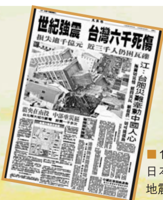
1999年9月22日本報報道台灣地震的版面。

秒，造成2,455人死亡，29人失蹤，11,305人受傷，51,711間房屋全倒，53,768間房屋半倒。由於台中市、南投縣為主震災區域，故受災特別嚴重。台灣新北市、台北市、苗栗縣、彰化縣、雲林縣等地亦有嚴重災情，估計全島經濟損失達新台幣3,600億元，折合美金約112.5億元，乃台灣戰後傷亡損失最慘重的天災。