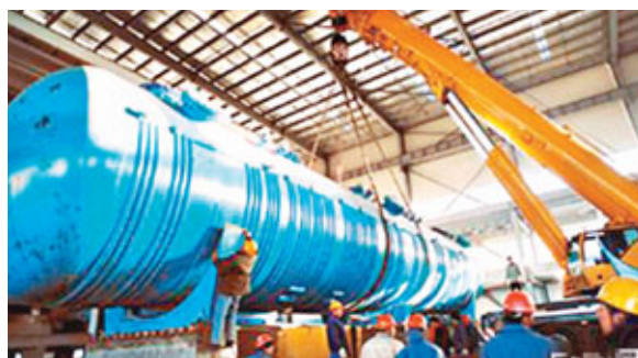
■甘肅金昌市把提升工業經濟發展質量，作為轉變發展方式的重中之重。