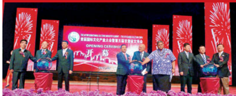
■首屆國際文化產業大會今年9月在甘肅嘉峪關市召開，該會致力於推動全球文化產業合作與發展。

今年全國「兩會」期間，甘肅制定了進一步加快文化大省建設的有關《意見》，其中一項重大決策是立足自身深厚的文化底蘊和豐富的文化資源，打造「華夏文明保護傳承和創新發展示範區」，把文化事業和文化產業的內涵融入其中，把華夏文明的挖掘、整理、傳承、保護、展示、創新、發展有機結合在一起，使之與時代精神相融合，與甘肅轉型跨越發展相融合，與老百姓的文化需求相融合。