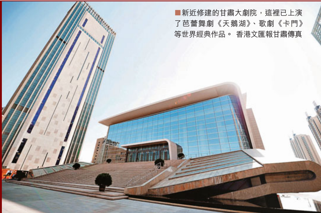
■新近修建的甘肅大劇院，這裡已上演了芭蕾舞劇《天鵝湖》、歌劇《卡門》等世界經典作品。香港文匯報甘肅傳真