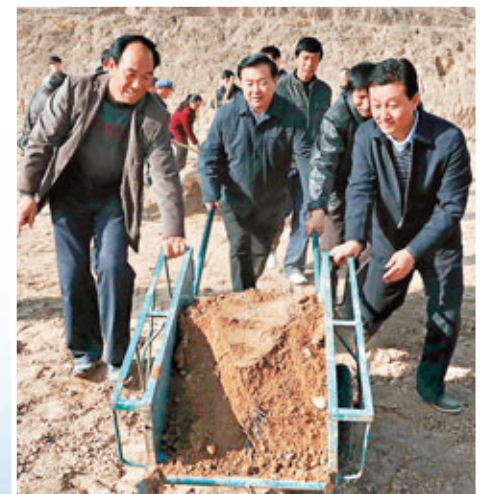
■聯村聯戶行動中，王三運親往地裡送農家肥。

此間政治觀察人士認為，這是王三運履新後推出的最重要的一項舉措。該項活動集扶貧攻堅、轉變機關作風、錘煉幹部隊伍、密切幹群關係、加強和創新社會管理等多重目的於一身，將成為今後甘肅政治生活中的常態。