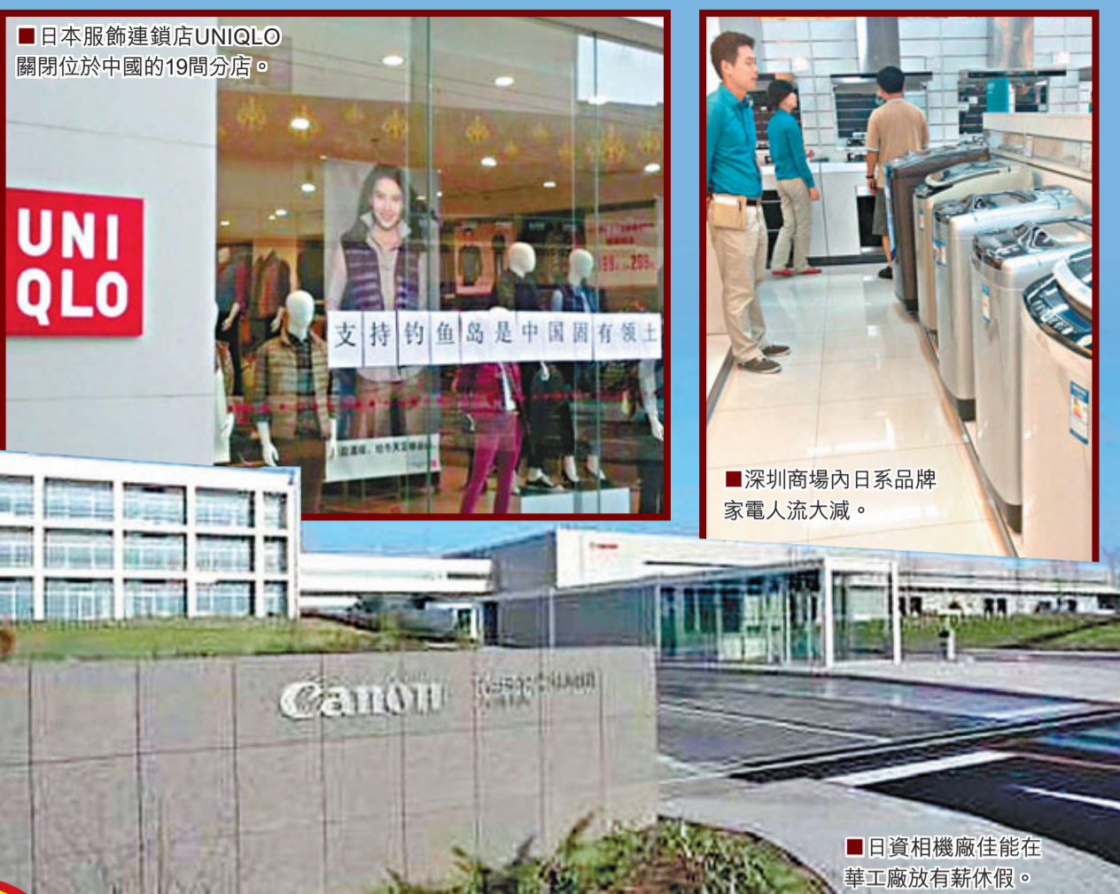
日本服飾連鎖店UNIQLO關閉位於中國的19間分店。