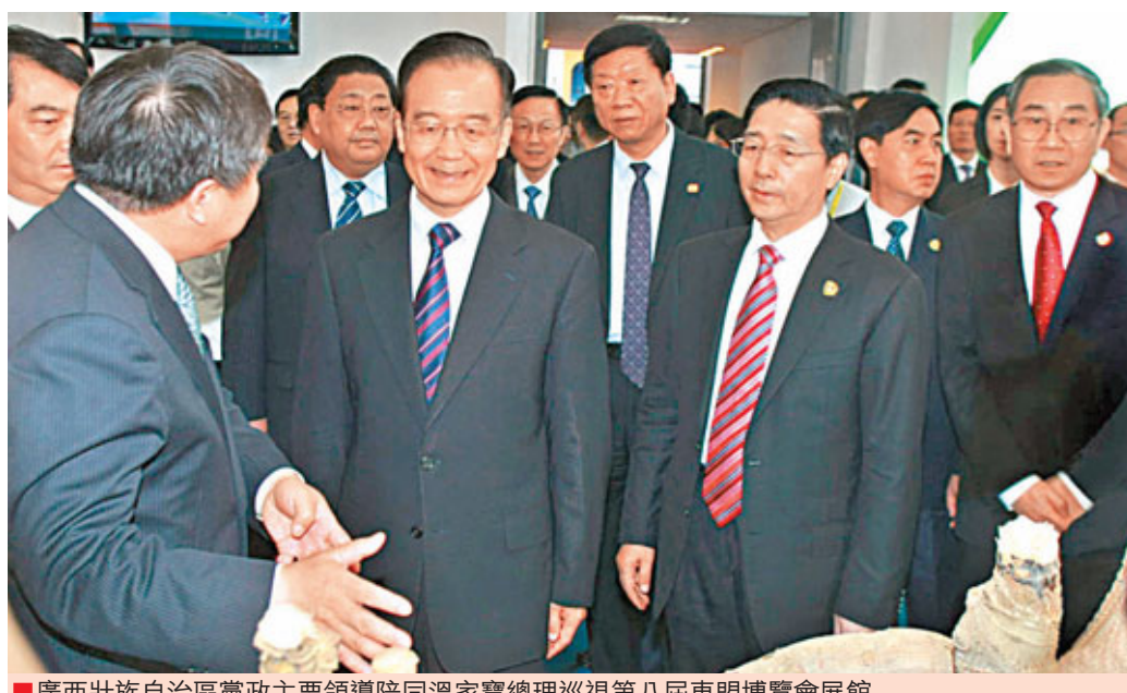
■廣西壯族自治區黨政主要領導陪同溫家寶總理巡視第八屆東盟博覽會展館