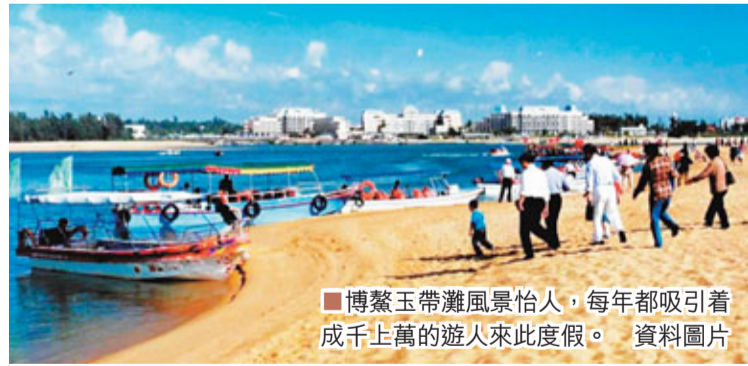
博鳌玉帶灘風景怡人，每年都吸引着成千上萬的遊人來此度假。

博鳌亞洲論壇自創辦以來，迄今已成功舉辦了11屆年會。中國主要領導人先後出席成立大會和歷屆年會，並發表演講。亞洲區域內外各國也對論壇給予高度重視，每年都有8-10位各國時任領導人和10餘位前政要出席，