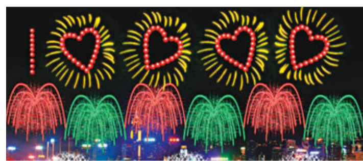
第6幕「愛的承諾」中，天空會打出紅色「1」字及4個心形圖案。