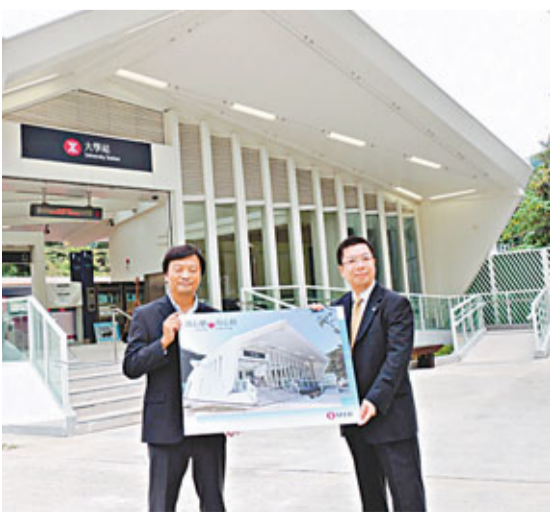
港鐵公司昨日宣布，港鐵大學站鄰近中文大學穿校巴士站處新設D出口本月28日啟用。香港文匯報記者李彩荷攝

香港文匯報訊(記者 文森)為了方便搭乘港鐵往中文大學的人士，以及疏導港鐵大學站其他3個出入口乘客流量，港鐵公司昨日宣布，港鐵大學站鄰近中文大學穿校巴士站處新設D出口本月28日啟用。教學大樓及校巴士站的人士帶來方便。他續稱，該工程歷時1年3個月完成，新出口共設有4個出入口開機，1個閘閘機，1個售票機及1個增值機，可疏導大學站其他3個出入口每日共逾3萬人次乘客流量。