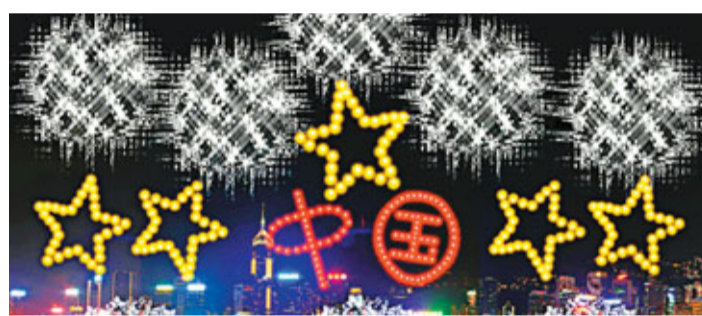
首幕會有金色「五角星」圖案及紅色「中國」字形。

首幕「慶祝國慶」，背景音樂「紅旗頌」為煙花匯演揭開序幕。毛偉城介紹指，這幕會有金色「五角星」圖案及紅色「中國」字形，向香港島及九龍各打出10次，希望兩岸觀眾均有機會看到。而「五角星」則象徵國旗