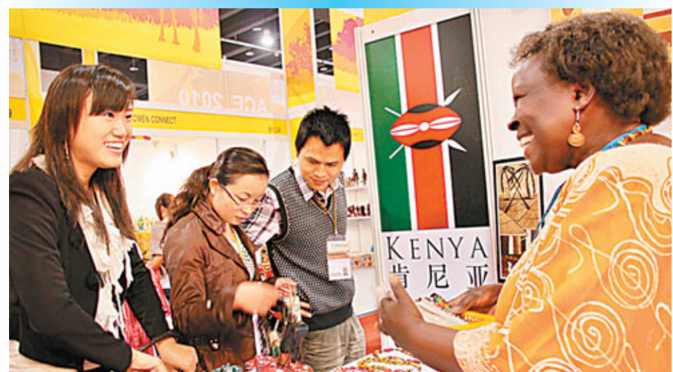
■義博會同期推出的非洲商品展備受客商青睞