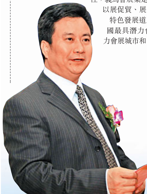
■義烏市委書記 黃志平

憑借獨特的市場優勢，良好的會展環境，突出的經貿實效性，義烏會展業走出了一條「以貿興展、以展促貿、展貿互動、共促繁榮」的特色發展道路。義烏先後被評為中國最具潛力會展城市、中國最具魅力會展城市和中國最佳會展城市。