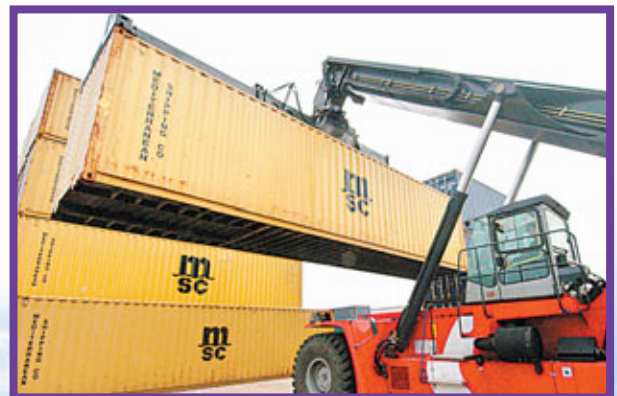
■全球經濟低迷，但義烏上半年外貿出口同比增長27.5%。

在今後一段時期，義烏會展業將繼續堅持展貿互動特色，充分依托市場優勢、產業優勢和外商資源優勢，堅持政府推動和市場運作相結合，堅持量的擴張與質的提升相結合，堅持扶持發展和規範管理相結合，按照市場化、專業化、品牌化、國際化的要求，着力改善會展業發展軟硬環境，推進會展業轉型升級，爭取早日把義烏打造成為重要的國家級會展平台。