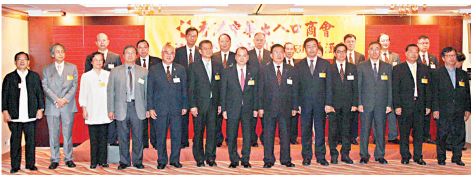
■香港中華出入口商會隆重舉行國慶酒會，賓主歡聚一堂。

香港文匯報訊（記者 陳巧顏）香港中華出入口商會17日假尖東苑酒家隆重舉辦慶祝中華人民共和國成立63周年酒會。中聯辦協調部部長沈沖、香港勞工及福利局局長張建宗、發展局局長陳茂波、行政會議成員鄭耀棠、工業貿易署署長麥靖宇、知識產權署署長張錦輝、民建聯主席譚耀宗、工聯會會長林淑儀、經濟動力召集人林健鋒等蒞臨主禮，近200人歡聚一堂，舉杯祝福祖國富強昌盛，香港繁榮穩定。