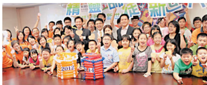
■義工導師、學員徒弟及徒孫將他們對計劃的期望及承諾放進時間囊，寓意彼此着重長遠的關係，互相扶持。

「精靈師徒新世代計劃」由新創建集團慈善基金贊助，集團義工及大小學員配對成14組三代「師、徒、孫」組合。師父將繼續擔當導師，已成長的青年學員將晉身為師友，帶領及關顧新招募的小學員。計劃設有不同主題的工作坊，包括魔術、扭氣球及故事手偶，由新創建集團的義工導師指導，讓徒弟及徒孫培養不同興趣，擴闊視野；徒弟更可從中學學習如何組織活動，提升領導能力。導師及所有學員更會獲安排參與義工服務，回饋社會。新創建集團慈善基金於2006年11月成立，至今已捐出接近港幣900萬元，資助與社會福利、環境保護、教育和健康醫療相關的公益活動。