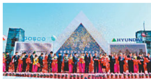
■琿春浦項現代國際物流園開工典禮。

香港文匯報訊(記者 廖一、張勳利 琿春報導)琿春浦項現代國際物流園日前開工建設。作為琿春打造東北亞地區國際物流基地重點項目，由韓國浦項集團投資13億元人民幣建設，佔地1.5平方公里。