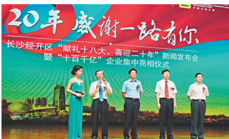
諾：每年力爭不低於8%銷售收入投入到研發。

自主創新是園區發展的制勝法寶。在長沙經開區這塊孵化沃土，一批工程機械巨頭，發揮自己的創新功力，不斷續寫新的傳奇：三一重工86米臂架泵車，中聯重科3,200噸履帶起重機、遠大空調15天建成30層酒店」的「三個世界之最」等展示長沙經開區創新發展的動力與追求。在現場發佈的「政企合作發展戰略宣言」中承