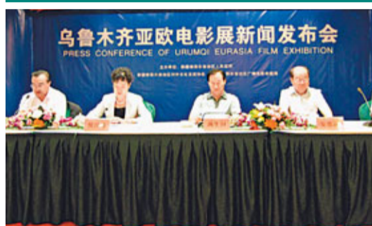
■新疆烏魯木齊首屆亞歐電影展新聞發佈會現場。

香港文匯報訊(記者 趙會芳 烏魯木齊報導)烏魯木齊首屆亞歐電影展在9月15日至20日在新疆烏魯木齊舉行，作為與第二屆中國—亞歐博覽會相銜的活動，新疆電影業將借此機會，參與到國際電影交流合作中。屆時民眾可以享受到題材廣泛、風格迥異的新疆及國內外優秀的電影作品。