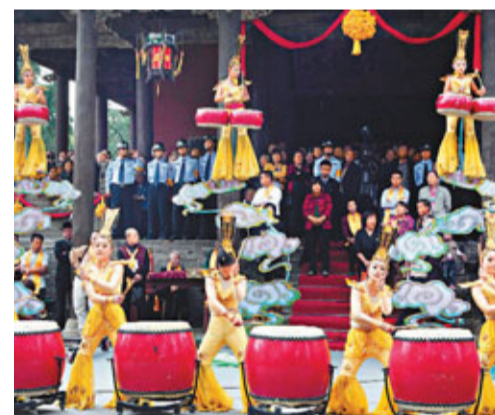
■「武功之舞」表演。

中國運城第23屆關公文化節17日在山西運城舉行，來自世界各地的千餘名華人聚集在運城解州關羽廟內，對關公進行秋日大祭。