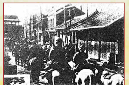
■1931年9月18日夜，日軍焚燒北大營的情景。 ■網上圖片

1931年9月18日夜，日軍以其製造的「柳條湖事件」為借口，大舉進攻瀋陽。當時，正是內戰時期。日本侵略軍乘虛而入，於9月19日佔領瀋陽，接着分兵佔領吉林、黑龍江。至1932年1月，東北三省全部淪陷。1932年3月，在日本帝國主義的支持下，傀儡政權——偽滿洲國在長春建立。從此，日本帝國主義把東北變成它獨佔的殖民地，全面加強政治壓迫、經濟掠奪、文化奴役，使我東北3,000多萬同胞慘遭塗炭，陷於水深火熱之中。