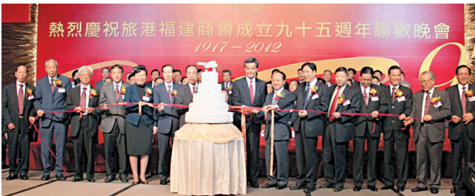
主禮嘉賓和旅港福建商會首長們一起切蛋糕，慶祝該會成立95周年。