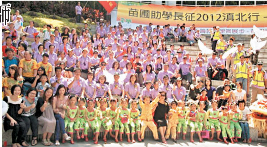
苗圃助學長征2012滇北行參加者與眾嘉賓合影。

參加者將於9月21日至30日到香格里拉步行80公里，由雲南省昆明市出發，途經麗江、奔子欄、明永冰川及普達措國家森林公園等地方，最後回到昆明市結束，為期10天。途中會探訪當地兩所小學，並與學生一起舉行課堂互動遊戲。有關活動詳情，可瀏覽「苗圃助學長征2012滇北行」網址：www.longmarch.org.hk 或苗圃行動網址：www.sowers.org.hk。啟動禮在醒獅帶領嘉賓及參加者進場後正式開始。主禮嘉賓中銀香港慈善基金董事、候任立法會議員吳亮星主持了授旗儀式