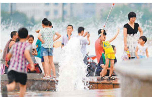
■山東大力改善民生，人民生活不斷改善。

今年「兩會」期間，山東省委副書記、省長姜大明表示，在全部兌現去年承諾的26件實事之後，今年山東省政府又把增加就業、健全社會保障體系、支持教育優先發展等7大方面35件實事列為工作重點。今年山東將再次提高企業最低工資標準、退休人員養老金、城鄉低保標準，開工保障性安居工程30.51萬套……姜大明坦言，雖然財政壓力比增大，但是老百姓的事要實幹。「少吃一頓飯，少買一輛車，能解決多少民生問題！」