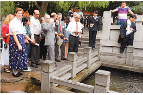
■外國友人參觀濟南的泉公園。