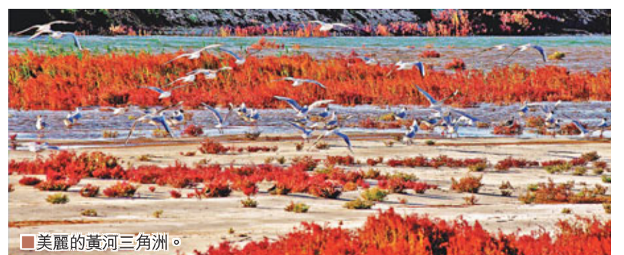
■美麗的黃河三角洲。

一黃一藍兩大戰略，成為山東經濟發展的重大引擎。藍黃「兩區」《規劃》批覆實施以來，山東突出「現代海洋」