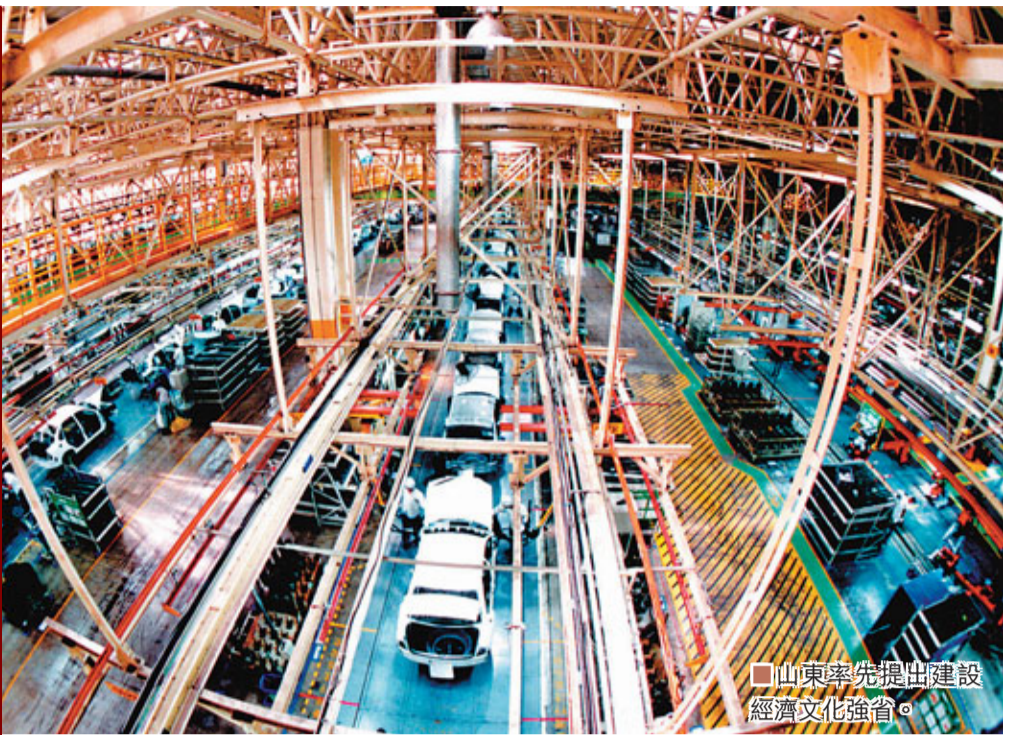
■山東率先提出建設經濟文化強省。