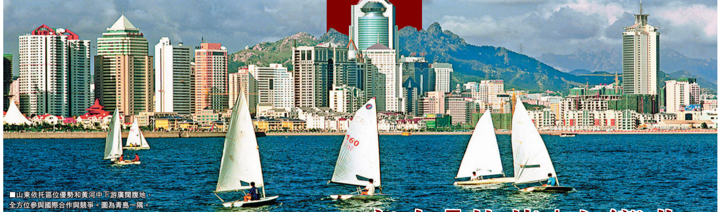
■山東依托區位優勢和黃河中下游廣闊腹地，全方位參與國際合作與競爭。圖為青島一隅。