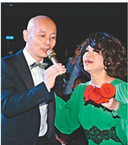
蔡琴落台下邀請葛優一齊合唱。