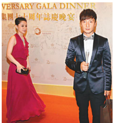
阿嬌曾一度欲與小方合照。