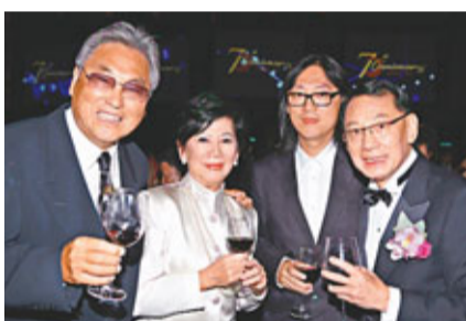
金漢與凌波亦有赴會。