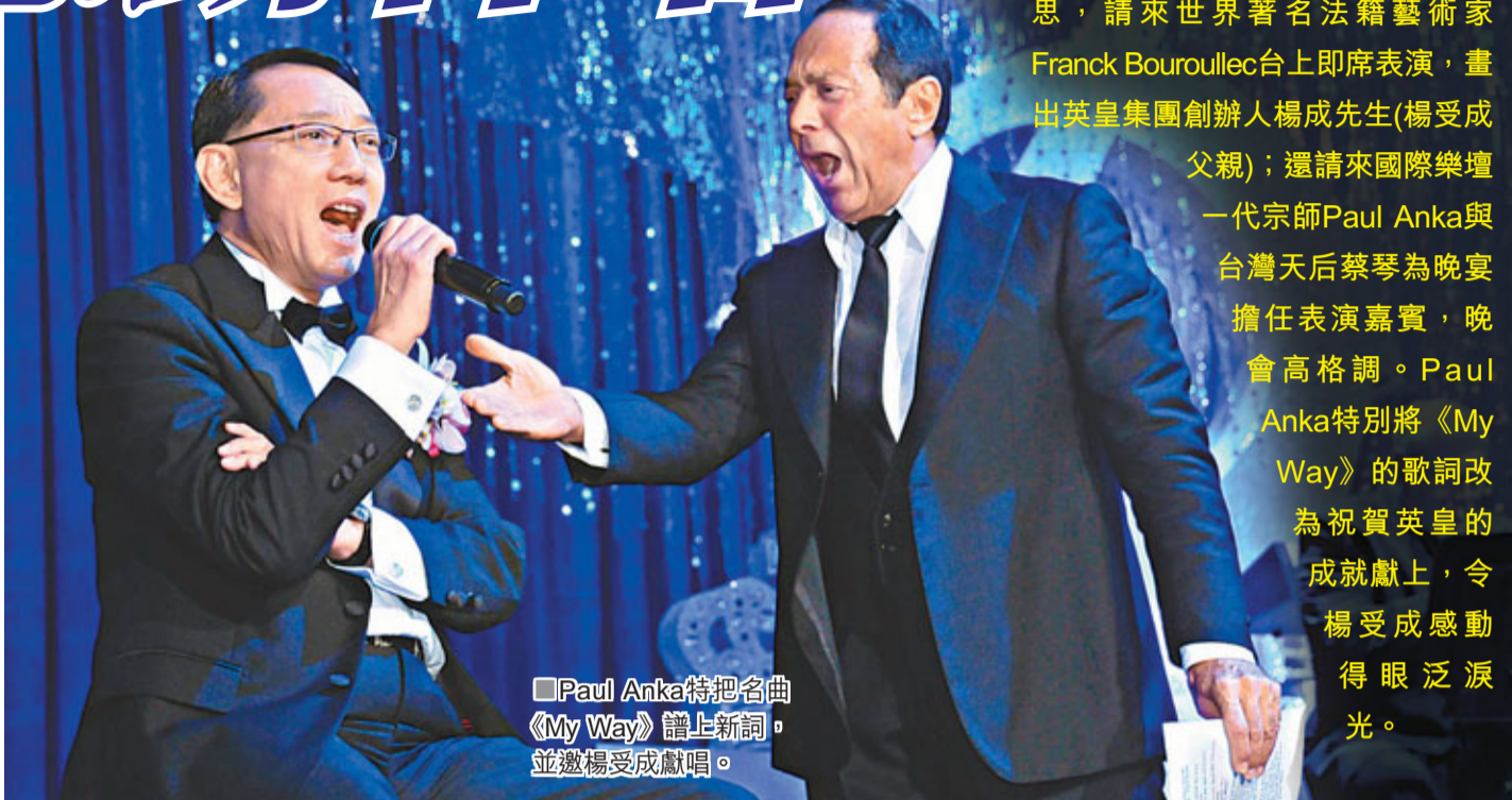
Paul Anka 特別將《My Way》譜上新詞，並邀楊受成獻唱。