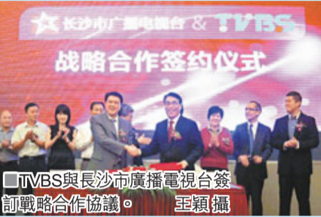
TVBS與長沙市廣播電視台簽訂戰略合作協議。

香港文匯報訊(記者 王穎 長沙報導)台灣TVBS無綫衛星電視台昨日與長沙市廣播電視台在長沙正式簽訂戰略合作協議，全面吹響進軍內地市場的號角。