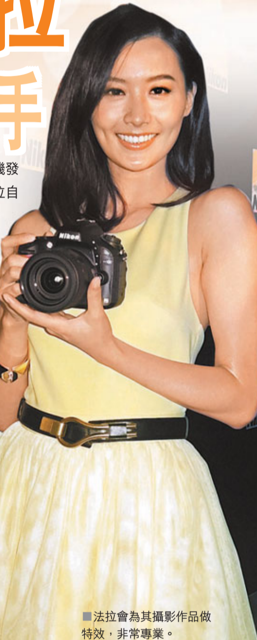
法拉為其攝影作品做特效，非常專業。