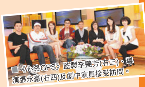
說：「唔係，覺得自己仍有進步空間。」小欣姐再要求二人握手言和，張導即時上前跟劉握手，再次向劉表示當日若令她感到不舒服，他在此致歉。

說到很多演員都指張導很惡，對此，張說：「可能追求完美過程，我都有少少同意，EQ仍有改進空間，(搞到演員喊又撞牆，會否後悔?)我手法令佢唔舒服，我可以講對唔住，當晚都有同佢道歉。」小欣姐問會否一次過向他罵過的演員道歉？張即認低威說：「我工作上可能太執着，我都同意，對唔住咁多位，以前工作上語氣不好，有所誤會，希望一次過清晒。」此時，劉突然忍不住落淚，問她是否感到委屈？她