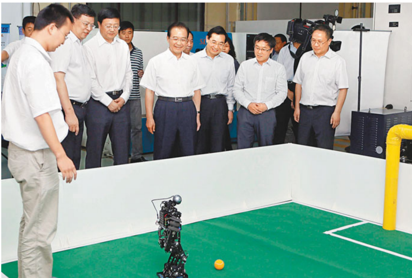
■國務院總理溫家寶昨日應邀到清華大學看望師生，並在學校大禮堂發表演講。這是溫家寶在機械工程學院製造系統實驗室觀看學生們演示機器人踢足球表演。

演講持續近1個小時。演講過程中，學生們不時報以熱烈掌聲。演講結束後，溫家寶在禮堂門口與師生們親切話別。