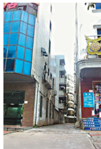
■官員自殺案發現場。

香港文匯報訊（實習記者 劉芳園 海口報導）海南瓊海市國土局副局長戴某13日上午從該市國土大廈跳樓身亡。目前，瓊海市警方已確定其為自殺身亡。