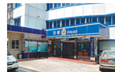
■事發羅湖派出所門外。

有消息稱兩人積怨已久，吳警官因工作上被不公平對待而對楊所長心存不滿，在衝突中，兩人是開槍互射致死。但據內部人士透露，調查結果疑為老警員拔槍射殺副所長後畏罪自殺。亦有圍觀者稱，當晚