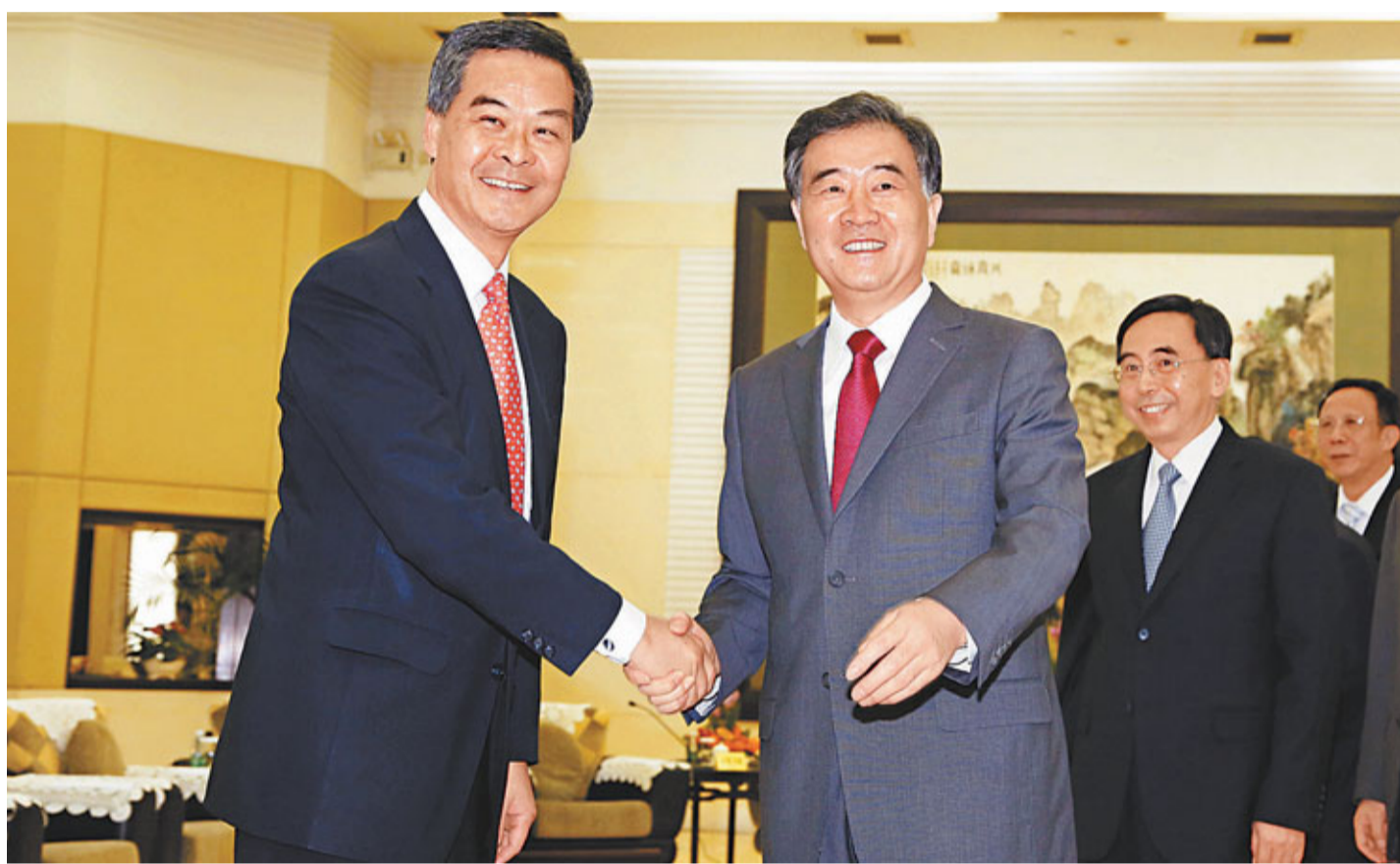
行政長官梁振英率代表團出席在廣州珠島賓館舉行的粵港合作聯席會議第十五次會議。圖為梁振英(左)與廣東省委書記汪洋握手。

港鐵公司行政總裁韋達誠表示，這是港鐵公司首次探討參與內地城際軌道項目。港鐵已做好充分準備，冀將港鐵的豐富經驗帶到廣東省。廣佛環綫城際軌道(佛山西至廣州南站段)全長36公里。項目落成後，乘客可於廣州南站直接轉乘港鐵深港高鐵路。