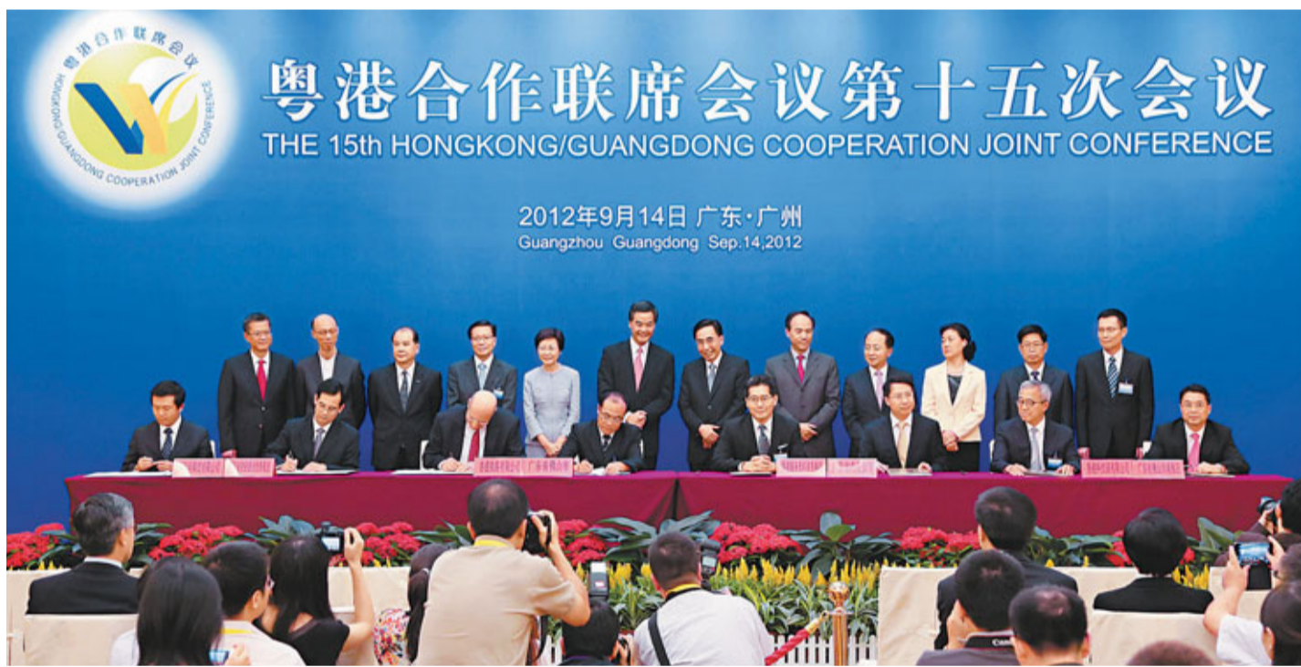
梁振英與朱小丹共同見證粵港合作協議簽署。