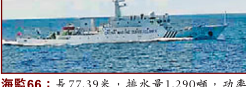
海監66：長77.39米，排水量1,290噸，功率2,380馬力，航速20節，續航力5,000海里，自持力30天