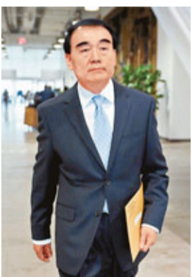
中國常駐聯合國代表李保東向聯合國交存釣魚島及其附屬島嶼領海基線坐標表和海圖。

據日本共同社報道，至當地時間下午1時20分（北京時間12:30）左右，進入釣魚島及附屬島嶼附近海域的中國海監船已全部駛出。而在紐約，中國常駐聯合國代表李保東大使昨日見聯合國秘書長潘基文，提交中國釣魚島及其附屬島嶼領海基線坐標表和海圖。至此，中國已履行了《聯合國海洋法公約》所規定的義務，完成了公布釣魚島及其附屬島嶼領海基線坐標的所有法律手續。