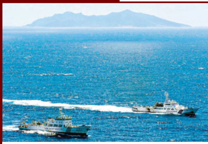
日本海上保安廳艦艇(上)緊逼監視中國海監船。