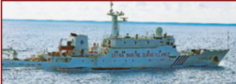
海監26：總重1,125噸，航速大於20節，是中國海監系列船舶中設計速度最快的千噸級公務船