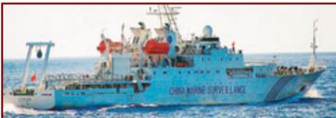
海監50：中國噸位最大、科技含量最高的海監船，型長98米，型寬15.2米，排水量3,980噸