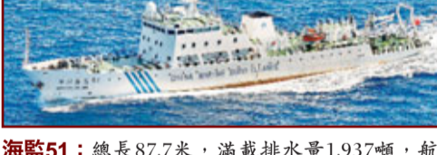
海監51：總長87.7米，滿載排水量1,937噸，航速18節，續航力6,000海里，自持力40天，定員50人