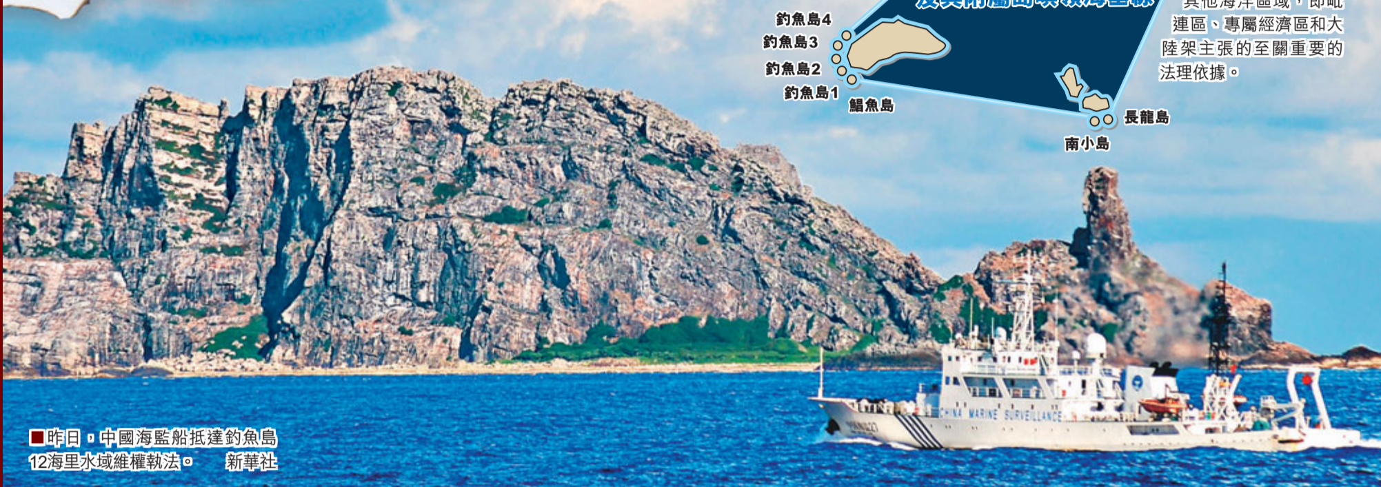
昨日，中國海監船抵達釣魚島12海里水域維權執法。

領海基線是沿海國建立在海洋管轄權主張的起始線。基線不僅對沿海國的領海主張有重要意義，而且是對其他海洋區域，即毗連區、專屬經濟區和大陸架主張的至關重要的法理依據。