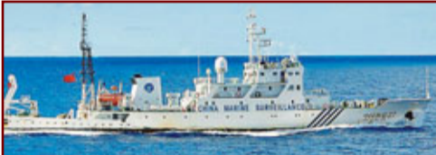
海監27：總長75.8米，排水量1,200噸，可載43人，上層建築為封閉式橋樓，設全景式駕駛室