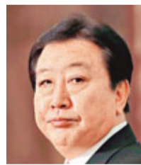
香港文匯報訊（綜合報導）對於多艘中國海監船前後出現在釣魚島附近海域，日本首相野田佳彥（見圖）昨日上午召集官房長官藤村修等內閣成員召開緊急內閣會議，就中國海監船編隊進入釣魚島海域巡航的應對策略進行研究。藤村指此次有6艘中國海監船（兩岸合共8艦船）駛入釣魚島附近海域是「前所未有的」。