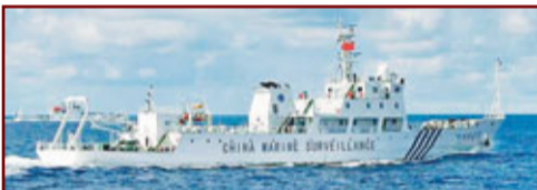
海監15：1,500噸級巡邏執法海監船，總長88米，排水量是1,740噸，續航力6,000海里