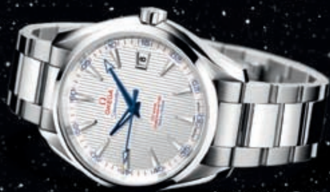
Seamaster Aqua Terra U.S. Ryder Cup Captain's Watch

OMEGA, maker of the first watch worn on the moon, is now a proud partner of the 2012 Ryder Cup. Growing the game of golf on Earth.