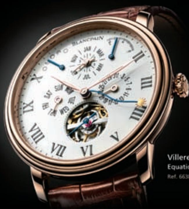
Villeret Collection Equation Marchante Ref. 6638-3631-558

IB 1735 BLANCPAIN MANUFACTURE DE HAUTE HORLOGERIE