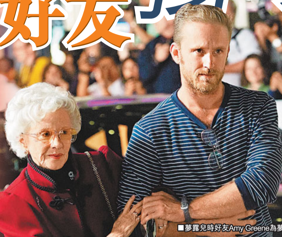
夢露兒時好友Amy Greene為夢露的紀錄片撐場。