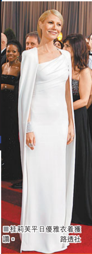
桂莉芙平日優雅衣着獲路透社讚。

外國雜誌《People》於美國時間本週三公佈影后級人馬桂莉芙柏德露(Gwyneth Paltrow)為2012年世界最佳衣着女性。桂莉芙得此殊榮，確是實至名歸。