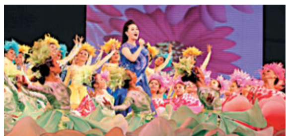
湘籍歌唱家雷佳亮相第四屆湖南藝術節，演唱會歌《萬紫千紅百花開》。

本屆藝術節以「藝術的盛會，人民的節日」為宗旨，將在長沙、岳陽、邵陽等地舉辦開幕式、閉幕式、舞台藝術新創劇(節)目展演、群眾文化舞台藝術展演、湖南書法美術攝影作品展覽等八大活動。藝術節還首次邀請了瑞典阿爾麥納合唱團、以及中國山西和新疆的優秀劇目，來湘交流演出和商演。