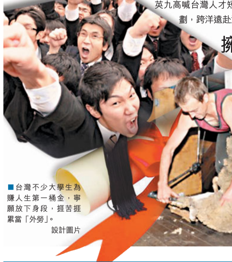
台灣不少大學生為賺人生第一桶金，寧願放下身段，捱苦捱累當「外勞」。

香港文匯報訊 綜合消息：台灣今年經濟不景，年度GDP增長或連「保一（1%增長）」都有困難，領導人馬英九高喊台灣人才短缺的同時，卻有大批擁有名牌大學學位的台灣精英學生利用澳大利亞「工作假期」計劃，跨洋遠赴澳大利亞。不過，他們不為體驗人生、不為旅遊觀光，也不為學習語言。