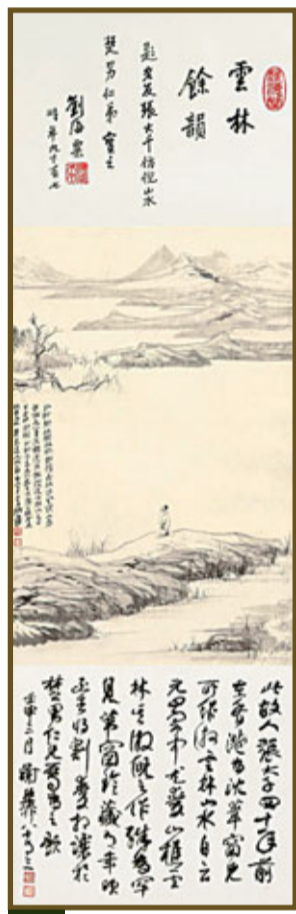
張大千 仿倪雲林山水 贈沈葦窗 水墨紙本 立軸 一九五二年作 劉海粟題詩堂 謝稚柳題跋

「情義之交」——「遊藝堂」珍藏張大千書畫精品展 地點：香港會議展覽中心(新翼)展覽廳3 日期：2012年10月5日至8日 時間：上午10時至下午6時半