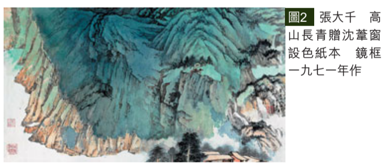
張大千 高山青贈沈葦窗 設色紙本 鏡框 一九七一年作