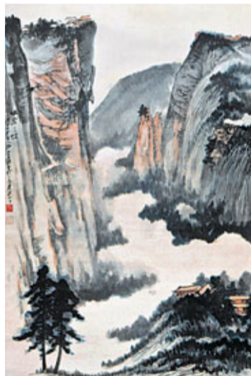
張大千 峨眉三頂 設色紙本 立軸 一九六〇年作 畫家自題紙盒、木匣及署簽