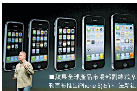
■蘋果全球產品市場部副總裁庫克宣布推出iPhone 5(右)。

iPhone 5強勢登場！蘋果公司在香港時間今日凌晨1時舉行發布會，正式發表全球蘋果粉絲引頸以待的iPhone 5。華爾街專家認為，即使新機未有「飛躍式」改進，仍足以掀起狂熱，預料月底前銷量可衝破1,200萬部。不過蘋果面臨