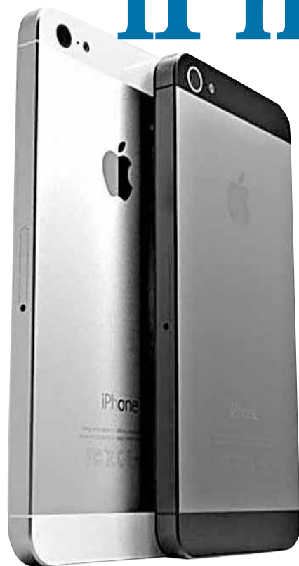
iPhone 佔蘋果一半收入，是盈利主要來源，故外界均期待蘋果行政總裁庫克帶來驚喜。iPhone

iPhone 5強勢登場！蘋果公司在香港時間今日凌晨1時舉行發布會，正式發表全球蘋果粉絲引頸以待的iPhone 5。華爾街專家認為，即使新機未有「飛躍式」改進，仍足以掀起狂熱，預料月底前銷量可衝破1,200萬部。不過蘋果面臨