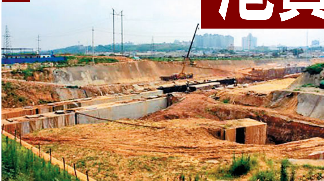
■武廣高鐵落戶之前，長沙市雨花區黎托鄉舊貌。