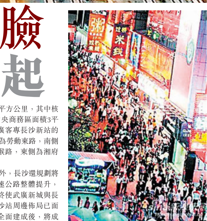
■武廣新城建成後人氣將趕超長沙五一商圈。 網上圖片

目前，長沙市政府已經對武廣新城作出具體規劃，西靠京珠高速，南至湘府東路，東、北兩面被風光秀麗的瀏陽河環