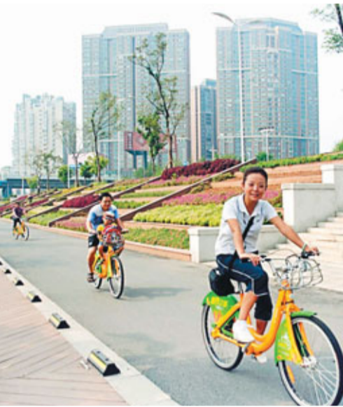
■自行車租賃服務在株洲的大街小巷隨處可見，成為城市一道靚麗的風景。