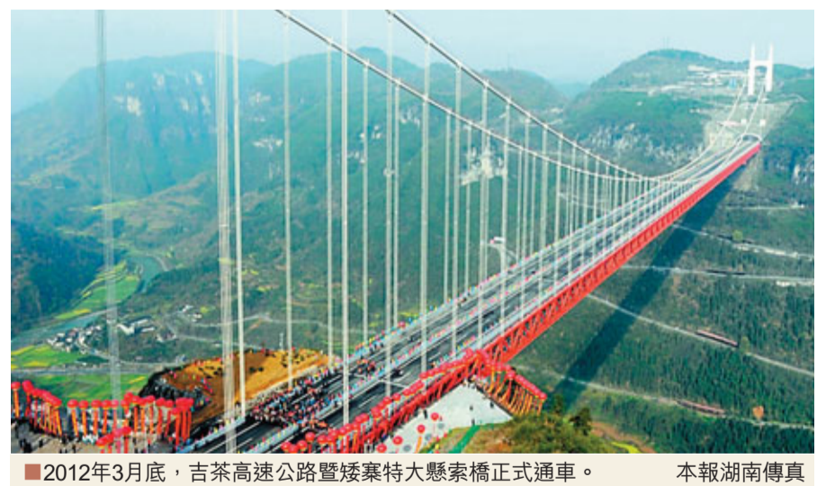
■2012年3月底，吉茶高速公路暨矮寨特大懸索橋正式通車。

通過全力抓產業結構調整和發展方式轉變，「十一五」期間，全省14個城市空氣質量全部達到國家二級標準，比2007年增加7個。長沙實現空氣質量優良率，河流斷面三類水率，污水和垃圾無害處理率「三個100%」，2011年榮獲「全國文明城市」稱號；株洲由全國十大污染城市轉變為現代工業文明為特徵的生態宜居型城市；湘潭躋身全國園林城市。