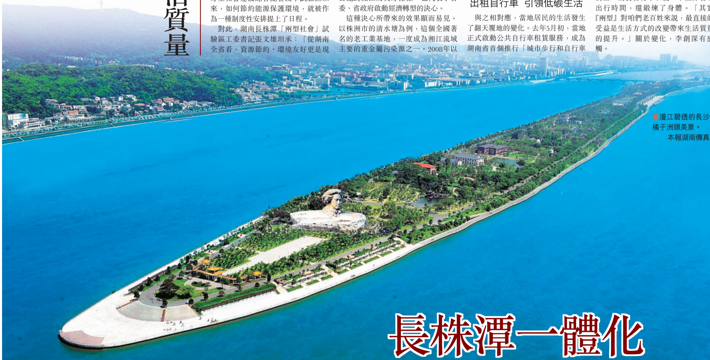
■漫江碧透的長沙橘子洲頭美景。