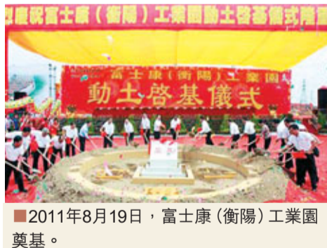
■2011年8月19日，富士康(衡陽)工業園奠基。

值得一提的是，今年8月4日，湖南召開了湘南承接產業轉移示範區首批重大項目建設推進大會，永州、衡陽、郴州3市共啟動項目92個，涵蓋46個產業項目，20個基礎設施項