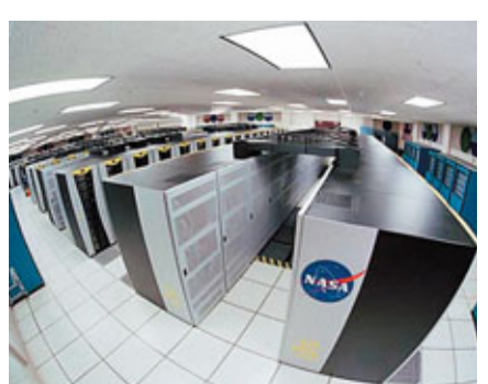
■位於長沙的國防科學技術大學研發的「天河一號」超級計算機。

此外，自主創新能力大大加強。官方披露數據顯示，「十一五」以來在風電、輕型飛機等領域實施科技重大專項36個，集中攻關272項關鍵瓶頸和共性技術難題，突破了新能源汽車、軌道交通高速機車交流技術、大型盾構設備研製及產業化、5兆瓦海上風力發電機組等一批關鍵核心技術。2011年，科技進步對