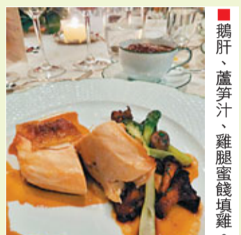
鵝肝、蘆筍汁、雞腿蜜餞填雞。