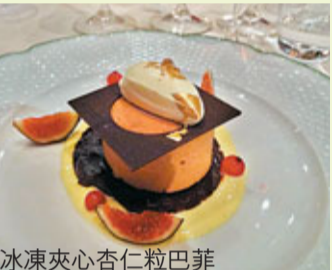
冰凍夾心杏仁粒巴菲