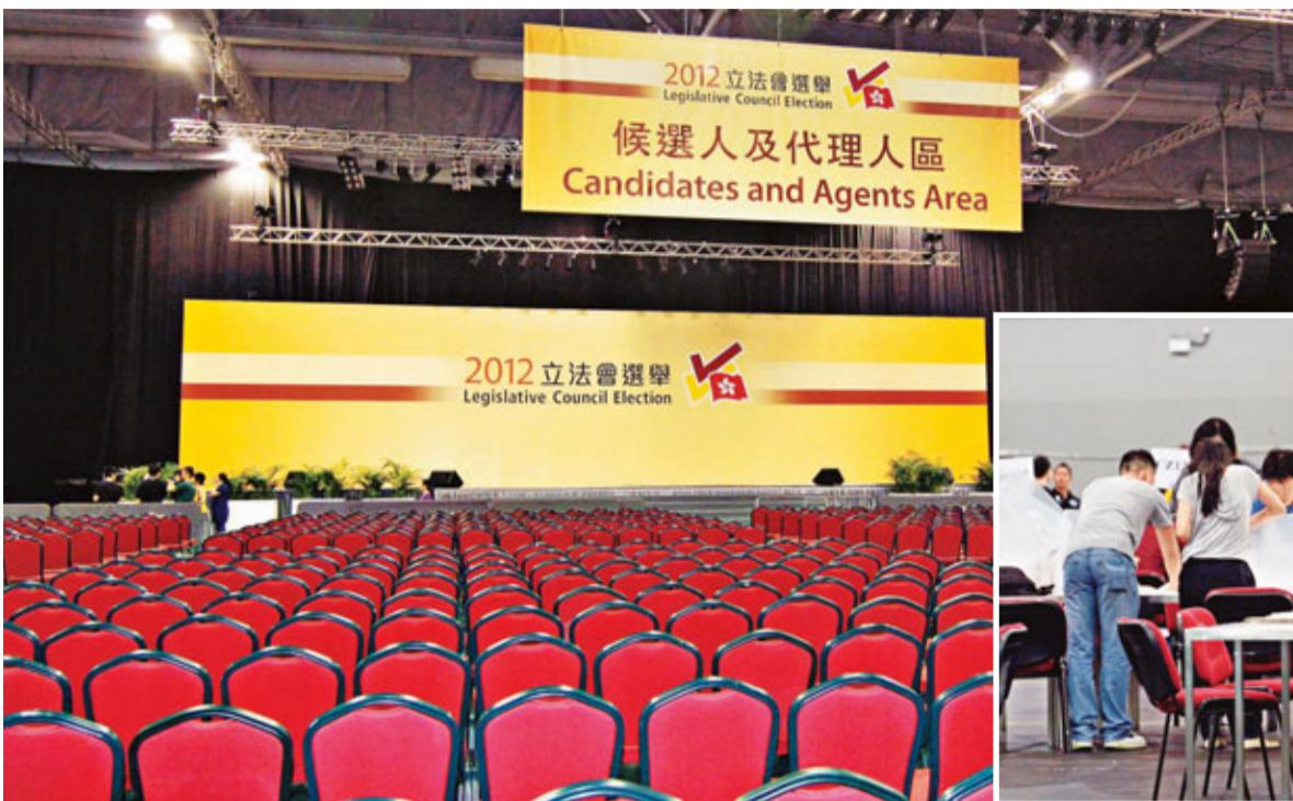
■位於亞洲國際博覽館的立法會選舉中央點票站。