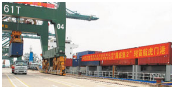
隨著「昌盛集2」抵達碼頭,虎門港至營口直達航線正式開通。

東方海運公司和南京鴻潤船務公司(以下簡稱「東方鴻潤」)將會繼續加大運力的投放。此航線南下將帶來糧食、礦產等貨物,北上則主要運送陶瓷、建材、石粉、快速消費品等。貨源地包括廣東東莞、廣州、佛山、廣西貴港、梧州等地區。