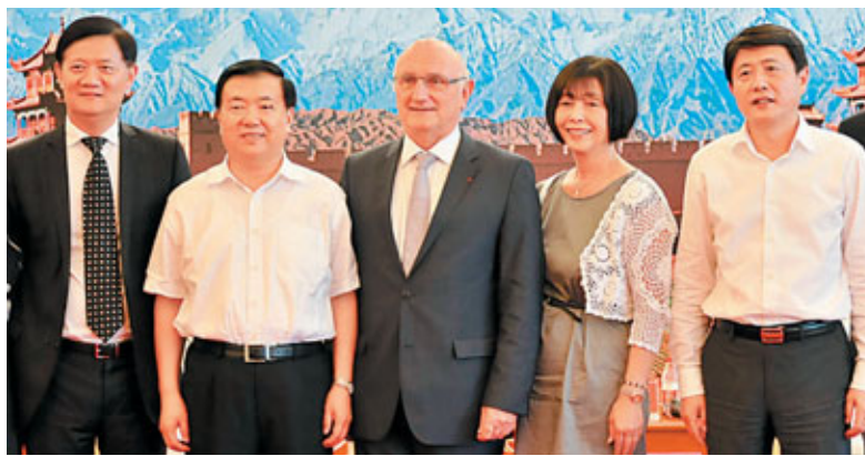
■王三運書記（左二）注重拓展甘肅旅遊的國際市場，為此8月初他與省長劉偉平（右一）會見世界旅遊業理事會副主席讓·克勞德·鮑姆加滕夫婦、聯合國世界旅遊組織亞太部主任徐京（左一）。

2012年，甘肅旅遊業正向接待7000萬人次、收入400億元、對GDP的貢獻達到7%的目標邁進。