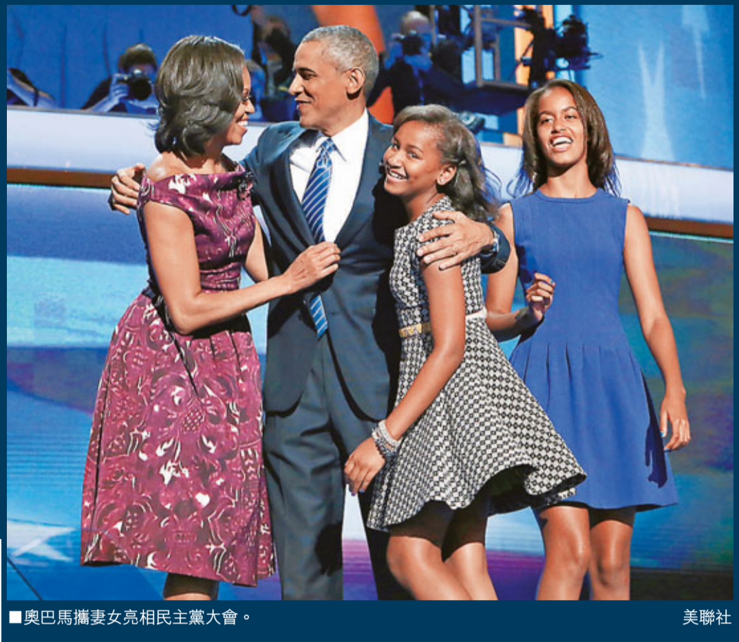
奧巴馬攜妻子女亮相民主黨大會。