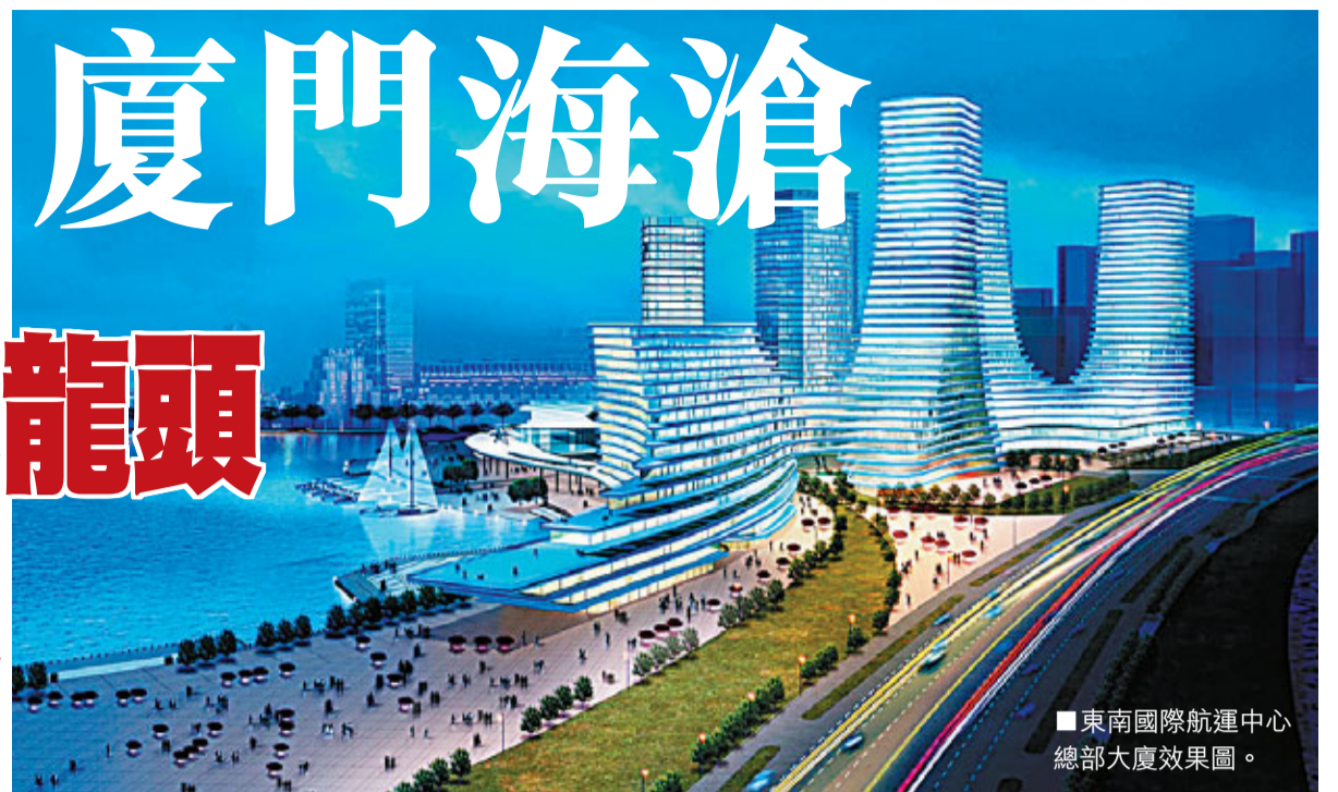
東南國際航運中心總部大廈效果圖。