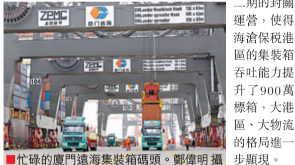
忙碌的廈門海滄集裝箱碼頭。

港口是海滄最大的優勢。作為福建省打造東南國際航運中心的核心港區，海滄港區設計貨物年吞吐量達1億噸，集裝箱1000萬標箱，擁有中國開放度最高、功能最齊全、政策最優惠、通關最便捷的海關特殊監管區域保稅港區。