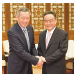
吳邦國在北京會見新加坡總理李顯龍。