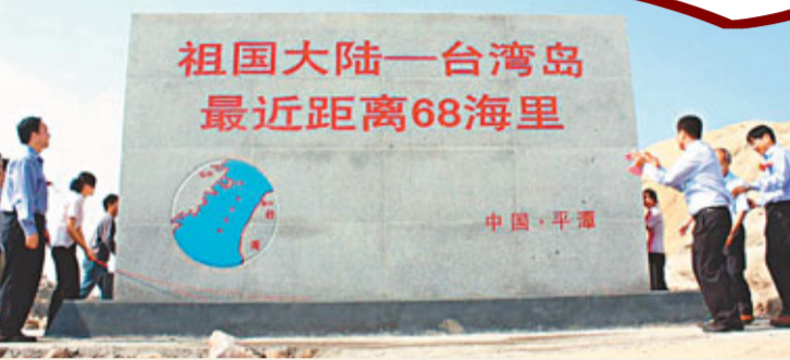
平潭距離台灣最近距離僅68海里。圖為兩岸最近距離點標註碑。

始於兩岸關係混沌之際的「小三通」，打破阻隔兩岸近60年的「堅冰」。立足兩岸地域前沿，福建省對台全方位交流由此進入「快車道」。在中央賦予「對台交流先行先試」的政策加持下，閩台經貿、旅遊、文化、農業等領域的互動，逐步摸索總結出諸如「小三通」等可資借鑒與推廣的成熟模式，為「大三通」之後的兩岸交流新局，奠定了扎實基礎。