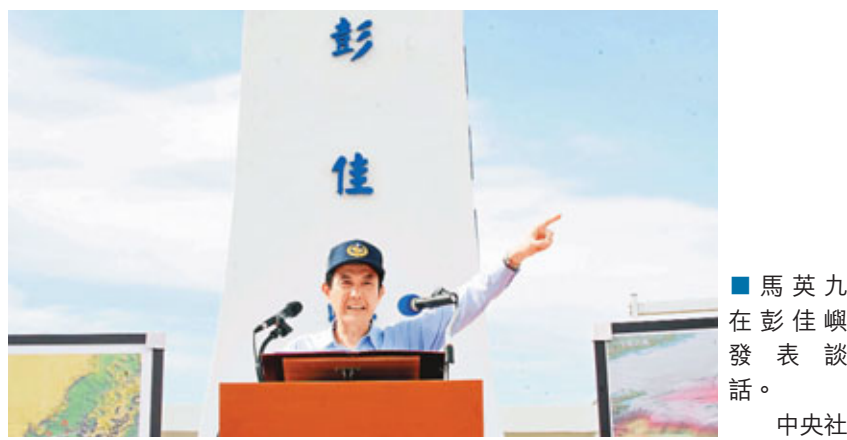
馬英九在彭佳嶼發表談話。

馬英九又建議,兩岸及日本方面可用對話代替對抗,協商擱置爭議,並先從「三組雙方對話」開始,就是中國大陸與日本對話、台灣與日本對話、兩岸對話,有共識之後,再進行