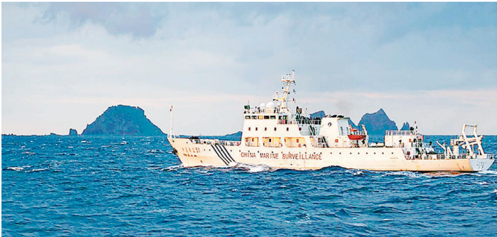
中國海監船在釣魚島附近水域航行。