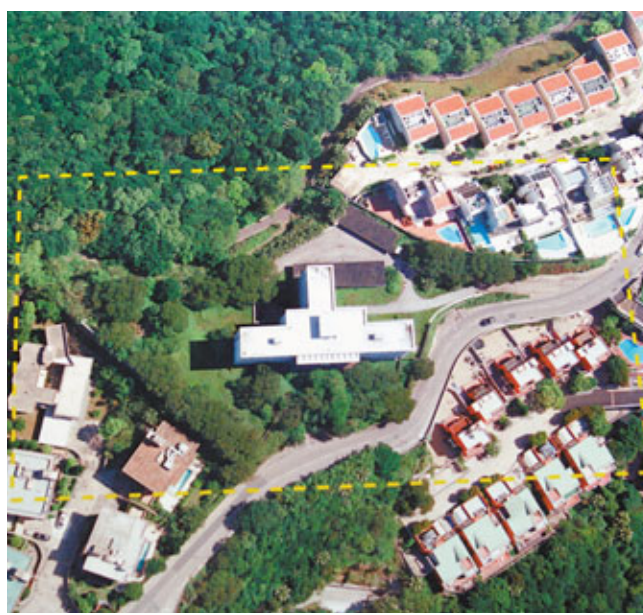
圖為新地早年以18億天價奪得的山頂加列山道12號地王地皮。資料圖片

另外,差餉物業估價署公布9月份「香港物業報告」每月補編,7月份樓價指數再創新高,最新報204.9點,按月升約1.24%,當中面積1,076方呎或以上的大單位報239.5點,按月升1.31%,面積1,076方呎以下的單位報203.6,亦升1.19%。租金指數升幅放緩,7月份報142.4點,升0.56%,相對6月時升幅1.94%,升幅明顯較之前為慢。