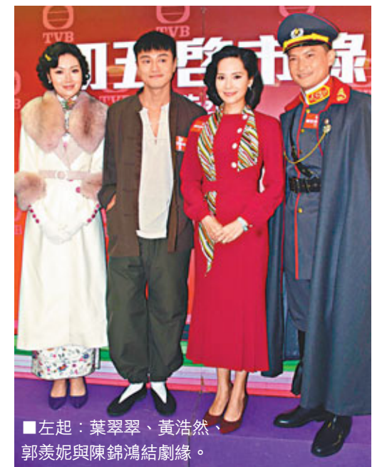
左起：葉翠翠、黃浩然、郭羨妮與陳錦鴻結緣。