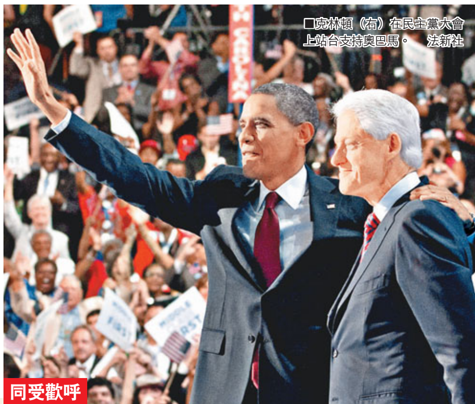
克林頓(右)在民主黨大會上站合支持奧巴馬。