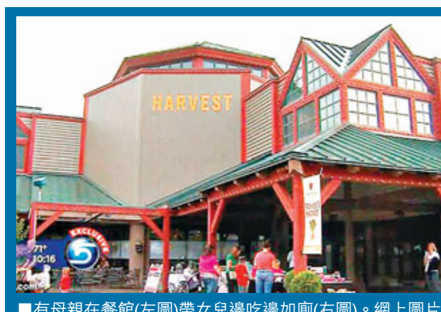
有母親在餐館(左圖)帶女兒邊吃邊上廁所(右圖)。網上圖片