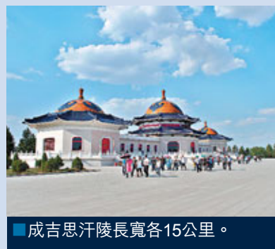
■成吉思汗陵長寬各15公里。