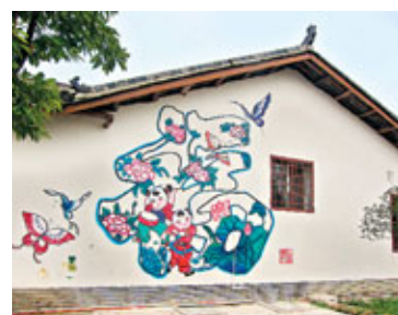
■年畫村裡每家每戶，牆外都繪有不同的圖案和文字。

位於四川西北部的德陽市，既是一個經濟高度發展的城市，也是一個旅遊資源豐富、文化積澱厚重的地方。這裡有最為人熟悉的三星堆文化遺產，有古代秦入蜀的最後一道屏障白馬關，有明清時代遺留下來「年畫」藝術，也有令人痛徹心扉的綿竹漢旺地震遺址。 這個距離成都不過40多公里的城市，讓人看到中國過去最輝煌的文化瑰寶，也有更多更多值得玩味的人文空間有待開發。