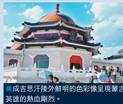
■成吉思汗陵外鮮明的色彩像呈現蒙古英雄的熱血剛烈。

也未走過未看過，中國很大，有很多地方我還未去過，一定要在有生之年走遍中國內地，然後再到外國見識見識。」 於是他跟家人及愛好騎車旅遊的朋友成立了「樺樹皮自行車俱樂部」，自組自行車團騎車遊中國，他們團隊的口號也甚為逍遙——「神遊中國，樂在騎中」。樺樹皮說他再忙，每年也會抽1至2個月的時間去騎車遊中國，每次的城市省份也不同。有時候只有他自己流浪，有時候和兒子或太太出走，有時候是和其他有志之士遠征。他還在河南老家經營單車背包客的生意和組織交流窮遊心得的背包客聯盟，把一生都傾注在背包旅遊的事情上。他說著說著，我突然覺得，那一刻，他的堅毅和決心有點像