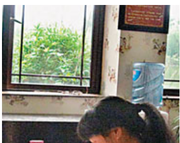
■婦女在專注地繡着年畫作品。

看著掛在牆上的各類年畫，心中不禁感嘆師傅精湛的手工，隨即在轉角處便看到一個婦女坐在一間小房子裡刺繡。隔著木門，婦女埋頭擺弄著針線，專注的神情隱隱透露出幾分堅毅，完全不受外面的聲音影響。回頭再看了看那些繡工精緻的年畫，難怪價格不菲，每針每線都是人手繡上去的，承載著綿竹婦女的祝福。