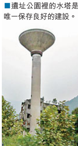
■遺址公園裡的水塔是唯一保存良好的建設。