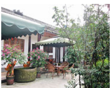
■在這裡只要幾十塊，便可以品茶、打牌，玩足一個下午。