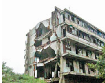
■房子外牆破裂，根本沒法住人。

地址：綿竹市漢旺鎮 交通：在綿竹城南汽車站乘車到漢旺，每五分鐘一班車，全程20分鐘。