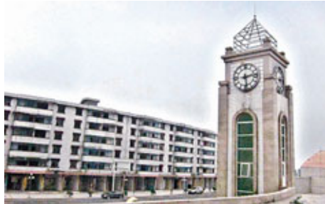
■2008年5月12日14:28分成為四川人永遠的痛。