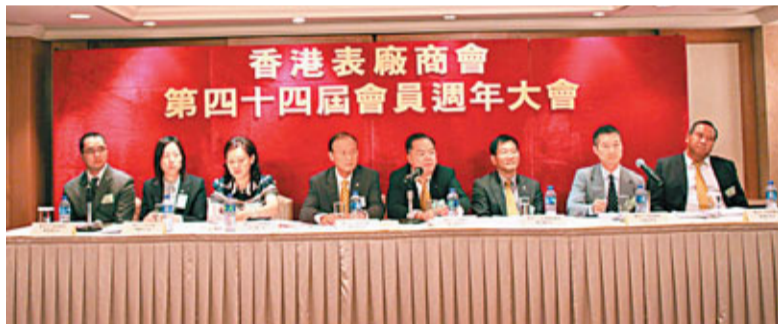
第四十四屆會員週年大會