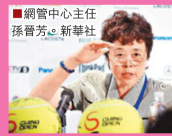
網管中心主任孫晉芳。