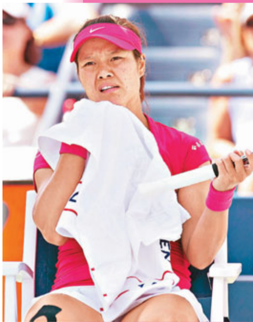
李娜被指比賽中易崩潰。