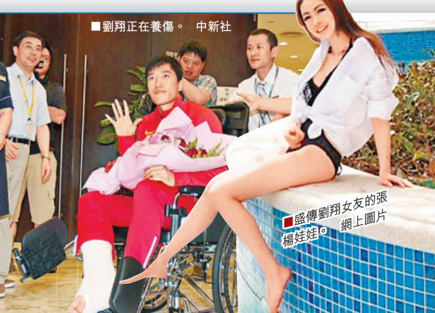
劉翔正在養傷。中新社

另據《新聞晨報》報道，距劉翔接受腳部手術已過去了近一個月，教練孫海平透露說，劉翔手術拆線後一直在靜養，預計10月上旬左右開始落地行走。香港文匯報記者 梁啟剛