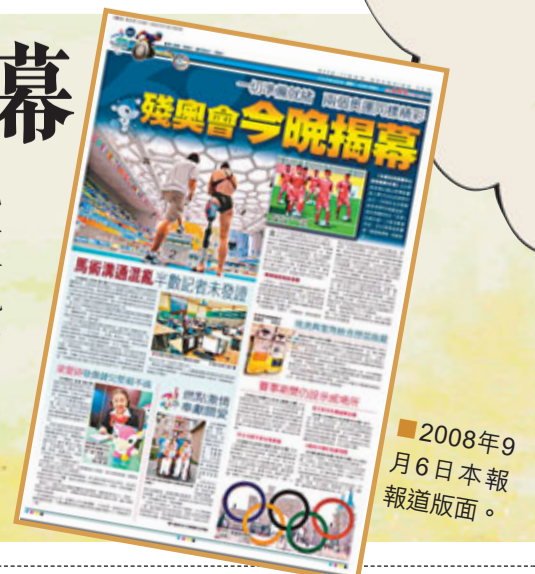
■2008年9月6日本報報道版面。

第十三屆殘奧會，中國共得到89枚金牌，70枚銀牌及52枚銅牌，居雙牌榜第一位。而香港亦得到5金、3銀及3銅，位列26位。