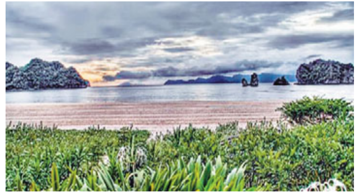
■美麗漂亮的馬來西亞國家風景

據了解,在2011年國家現代肉羊產業技術體系羊肉加工技術研討會暨中國鹽池灘羊產業發展論壇上,寧夏與馬來西亞在清真食品