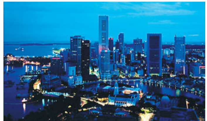
■美麗的馬來西亞夜景

同時中國與伊斯蘭世界不僅在清真產業和穆斯林用品方面合作,而且涉及到能源產業等多領域的合作。實現互利共贏,是中阿實現自身發展的需要,是進一步加強中國與阿拉伯國家「全面合作、共同發展」戰略合作關係的具體表現。