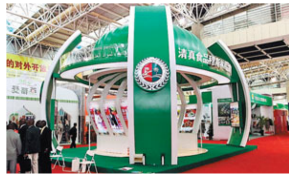
■清真食品穆斯林用品展

據了解,在2011年國家現代肉羊產業技術體系羊肉加工技術研討會暨中國鹽池灘羊產業發展論壇上,寧夏與馬來西亞在清真食品