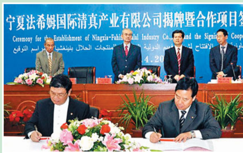
■寧馬清真產業合作簽約儀式