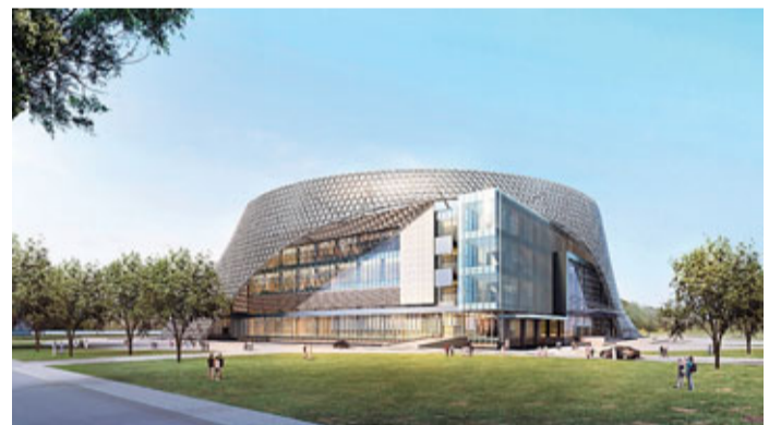
■中阿經貿論壇永久會址3D效果圖

IBM公司負責人表示,可以將其在中國山東等地建設的食品安全追溯體系移植到寧夏的清真食品體系上來。通過可追溯體系,可以追蹤到清真食品從飼料、餵養到屠宰、加工、流通的每一個環節,食品出現問題後可以精準的找到問題環節並加以改進,形成從農田到餐桌的全產業鏈食品安全控制體系。馬來西亞狄維納集團負責人介紹了馬來西亞的清真產業信息高速公路的建設情況。該負責人認為,寧夏自然資源豐富,具有將清真產業與綠色、有機產業結合的優勢條件。如果能建立起與國際接軌的清真產業的規範標準和安全體系,將為寧夏清真產業帶來巨大商機,極大地促進寧夏清真產業走向國際市場。