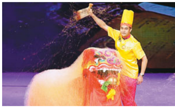
■神奇的清真烹飪藝術表演