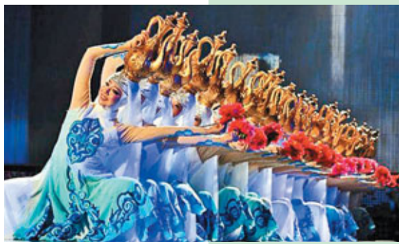
■精彩的回族舞蹈《金色湯瓶》