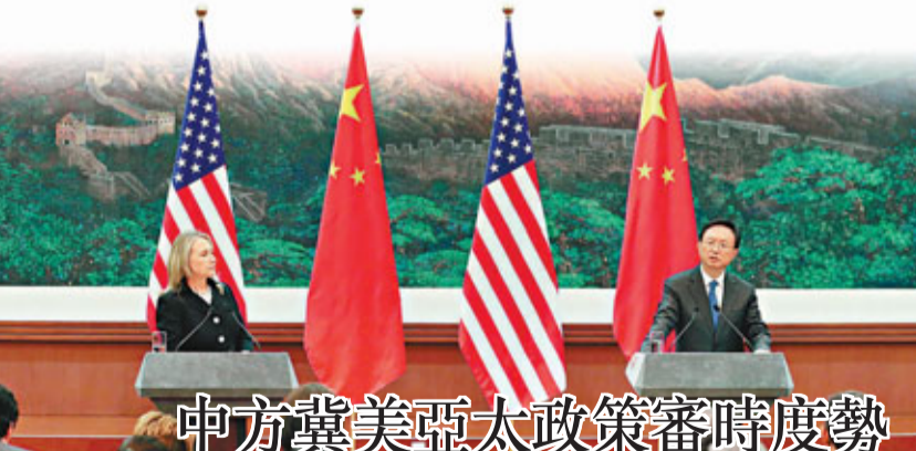
■楊潔篪(右)與美國國務卿希拉里共同會見記者。

希拉里表示贊同溫家寶對中美關係重要性的看法。她說,中美關係儘管經歷過波折,但兩國有許多共同看法,在應對國際金融危機中密切合作,為促進世界經濟復甦做出了貢獻,美方讚賞中國發揮的關鍵作用。當前,世界經濟形勢仍很脆弱,中美關係面臨新的機遇和挑戰,尋求互利共贏符合雙方利益。美方願與中方加強高層交往和民間交流,充分發揮各種對話機制的作用,增進相互了解與合作,推動中美關係不斷向前發展。