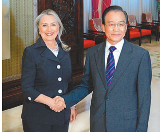
■胡錦濤(右)會見希拉里時表示,確保中美關係沿着正確方向前進。