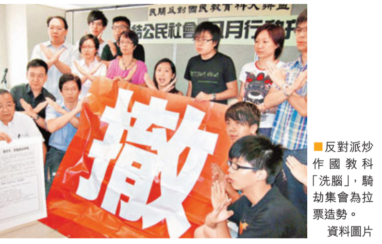
反對派抄作國教科「洗腦」，騎劫集會為拉票造勢。 資料圖片

在立法會選舉投票日前夕，「民間反國民教育科大聯盟」突然發起激烈的絕食行動，多位反對派人士更粉墨登場，直接參與絕食。市民需要警惕的是，反對派將會在投票的最後關頭，將絕食行動推向極端，製造絕食人士昏迷之類惡性事件，搞出更大的悲情以刺激市民的情緒，以影響選情。