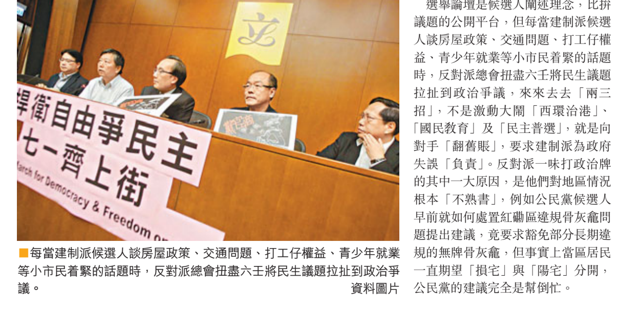
每當建制派候選人談房屋政策、交通問題、打工仔權益、青少年就業等小市民最關心的話題時，反對派總會扯出王蔭生議員扯到政治爭議。