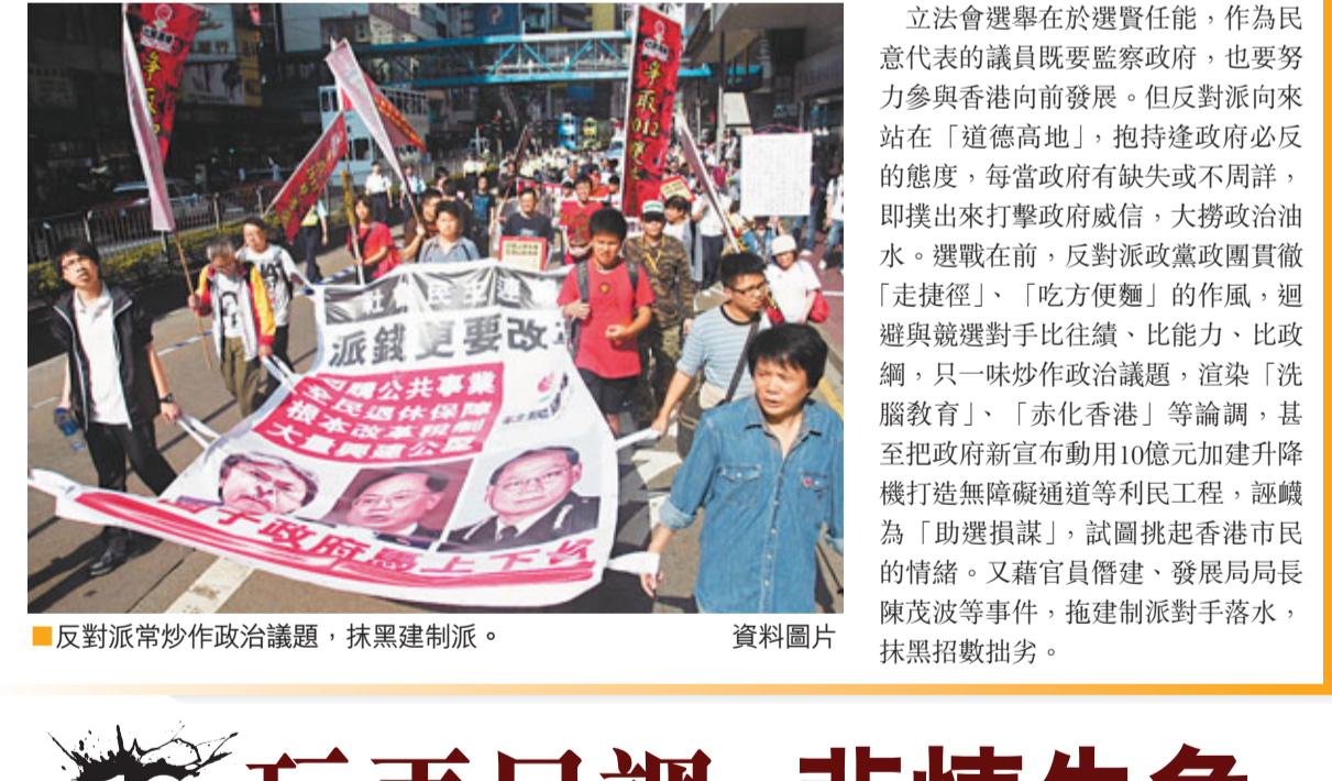
反對派抄作政治議題，抹黑建制派。 資料圖片

立法會選舉在於選民投票，作為民意代表的議員既要監察政府，也要努力參與香港向前發展。但反對派向來站在「道德高地」，抱持建政必反的態度，每當政府有缺失或不周時，即提出來打擊政府威信，大撈政治油水。選戰在即，反對派政黨團貫徹「走極左」、「吃方便麵」的作風，迴避與競選對手比業績、比能力、比政綱，只一味炒作政治議題，渲染「洗腦教育」、「赤化香港」等論調，甚至把政府新宣布動用10億元加建升降機打過無牌擺通等同一程度，被視為「助選損票」，試圖挑起香港市民的情緒。又藉官員晉陞、發展局長陳茂波等事件，施建派對手落水，抹黑招數拙劣。