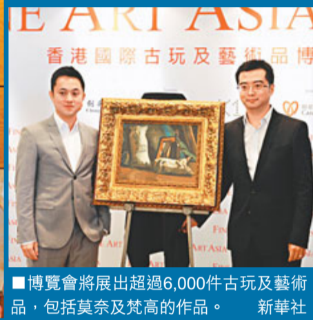
博覽會將展出超過6,000件古玩及藝術品，包括莫奈及梵高的作品。新華社

香港文匯報訊 第八屆香港國際古玩及藝術品博覽會將於10月4日至7日假香港會展舉行。參觀者屆時可欣賞到超過6,000件藝術珍品，總價值逾20億元，包括印象派大師莫奈、梵高的畫作。