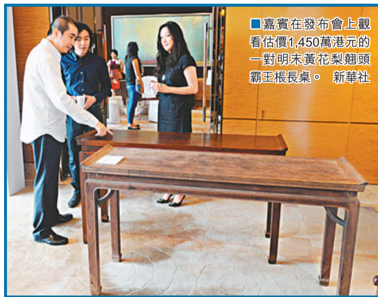
嘉賓在發布會上觀看估價1,450萬港元的一對明末黃花梨翹頭霸王長桌。

倖存者和家屬帶同早前收集到的約4萬個市民簽名，以及一封寫給國家領導人的信件交予梁振英，希望他能轉交，同時反映家屬的訴求。謝志恆表示，簽名反映市民對事件的關注，促請特區政府和中央一起跟進事件，為受害者和家屬討回公道，包括菲律賓政府向他們作出道歉和賠償、處分失職的官員、改善當地的旅遊情況和保障旅客安全等。