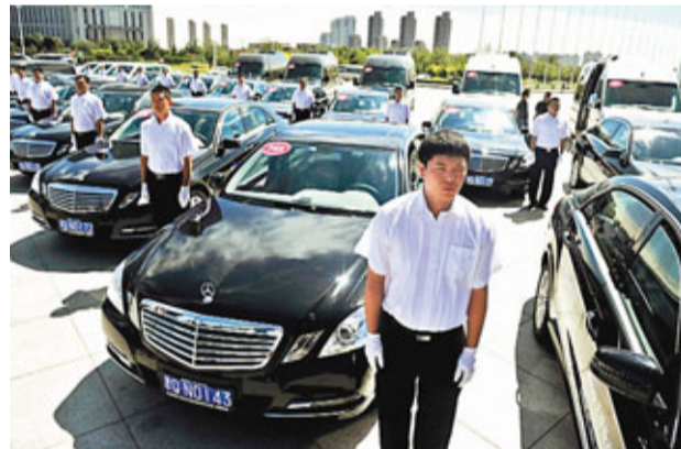
天津舉行2012夏季達沃斯論壇指定用車交車儀式。

洪磊稱,中方希望本屆論壇充分討論當前世界經濟面臨的突出問題,傳遞積極信息,為推動世界經濟復甦凝聚中心和力量。