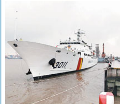
韓國海洋警察廳3011訓練艦昨日造訪中國海監總隊,停靠在中國海監東海總隊碼頭。