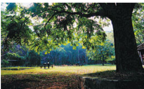
■家樂徑四周蒼翠樹木襯托，環境清幽。

此路徑環繞河背水塘而建，全路平坦，自河背村出發，沿路南行，兩旁樹木成蔭，走至水壩，波平如鏡的碧綠水塘即展現眼前，教人心曠神怡。河背水塘面積雖小，卻盡顯山光水色之美。沿家樂徑漫步，正可從不同角度欣賞水塘風貌，因此是不少攝影愛好者的取景勝地。