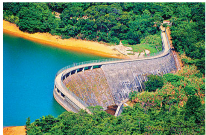
■河背水塘家樂徑環繞河背水塘而建，走畢全程約40分鐘。

河背水塘建成於1961年，坐落在香港元朗八鄉、海拔250米高的群山環抱中，位處錦田河上游，屬於大欖郊野公園的一部分，自然環境十分優美。1998年漁護署曾將其選為郊野公園十大自然風景之一。