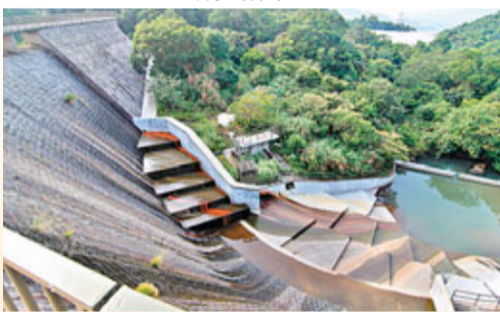
■頗具特色的河背水塘S字形十九孔溢洪大壩