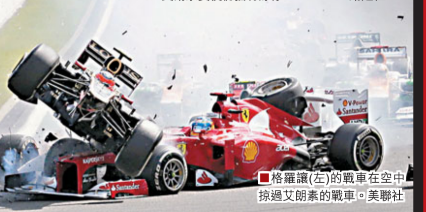
格羅讓(左)的戰車在空中掠過艾朗素的戰車。