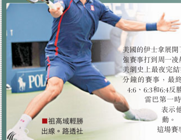
祖高域輕勝出線。

德國男網球手高舒雷巴與美國的伊士拿展開了漫長一戰，兩人周日在32強賽事打到周一凌晨2時26分才「收工」，追平美網史上最夜完結賽事的紀錄。歷時3小時20分鐘的賽事，最終由高舒雷巴以6:4、3:6、4:6、6:3和6:4反勝對手。賽事結束後，高舒雷巴第一時間感謝滿足全場的球迷，表示他們的捱夜支持實在令他感動。這場賽事成功平了美網史上最夜完